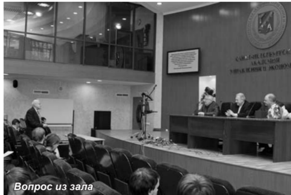
Вопрос из зала

Тема модернизации российской экономики стала в последнее время доминирующей в дискуссиях специалистов и широкой общественности. О том, что страна вступила на путь модернизации, все время говорит и Президент РФ Д.А. Медведев. Модернизация – это обновление. «Россия за последние 120 лет уже трижды вставала на путь модернизации», – отметил Н.Я. Петраков. В конце XIX – начале XX веков Россия сделала мощный рывок в создании промышленной высокоразвитой страны. Вторжение модифицированной российской промышленности в экономику Европы было столь впечатляющим, что стало одной из экономических причин первой мировой войны. После ее окончания и после гражданской войны Россия вновь пыталась возродиться как современное экономи-