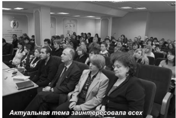
Актуальная тема заинтересовала всех