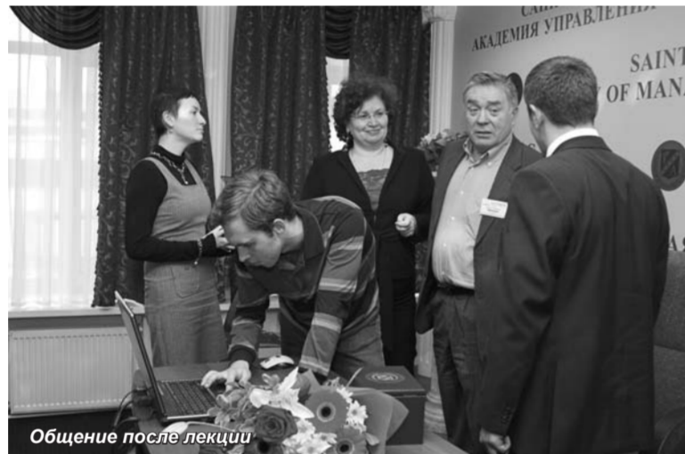
Общение после лекции

го неравенства и бедности? Ответ на этот вопрос дает анализ структурной динамики показателей неравенства в регионах России, который позволяет по-новому взглянуть на проблему чрезвычайно высокого социально-экономического расслоения российского общества и причины, ее порождающие. Этот анализ показывает, что основной причиной являются существующие сегодня механизмы формирования и перераспределения доходов населения и их деформация, связанная, прежде всего, с настройкой этих механизмов в пользу богатых. Отсутствие продуманной системы выравнивания доходов и имущественного положения различных групп населения приводит к углублению разрыва между наиболее обеспеченными и беднейшими слоями населения. Профессор А.Ю. Шевяков постарался ответить на во-