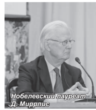
Нобелевский лауреат Д. Миррлис