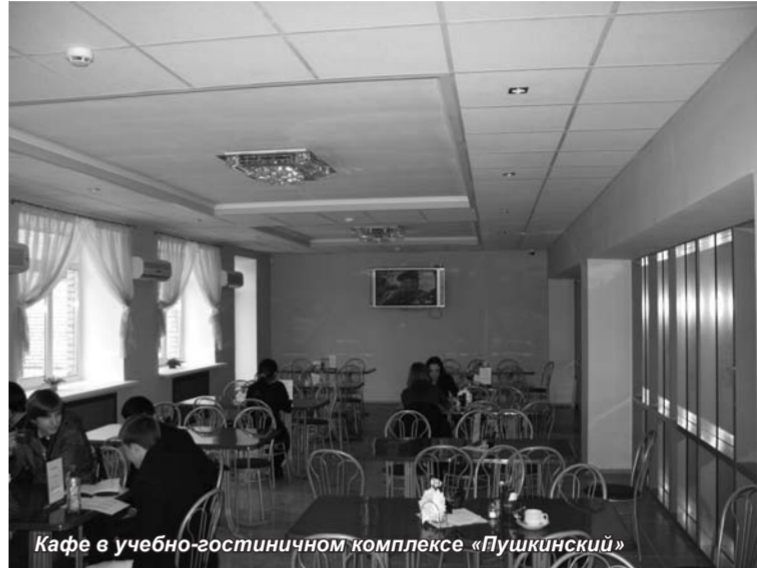
Кафе в учебно-гостиничном комплексе «Пушкинский»

Студенческая жизнь в общежитии разнообразна и очень интересна. Культурные мероприятия для студентов проводятся в соответствии с планом воспитательной работы на 2010-2011 учебный год в их свобод-