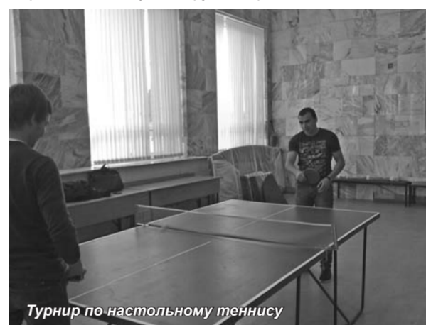
Турнир по настольному теннису