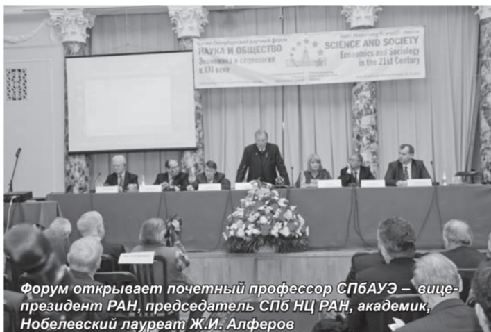
Форум открывает почетный профессор СПбАУЭ – вице-президент РАН, председатель СПб НЦ РАН, академик, Нобелевский лауреат Ж.И. Алферов

С 18 по 22 октября в Санкт-Петербурге состоялась встреча Нобелевских лауреатов, уже пятая по счету. Первая Санкт-Петербургская встреча Нобелевских лауреатов, «Наука и прогресс человечества» состоялась в 2003 году. В 2005 году за ней последовала еще