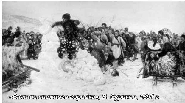
«Взятие снежного городка», В. Суриков, 1891 г.

Студенты Красноярского института экономики приняли участие в Фестивале народной культуры, который прошел 6 марта в селе Сухобузимском Красноярского края.