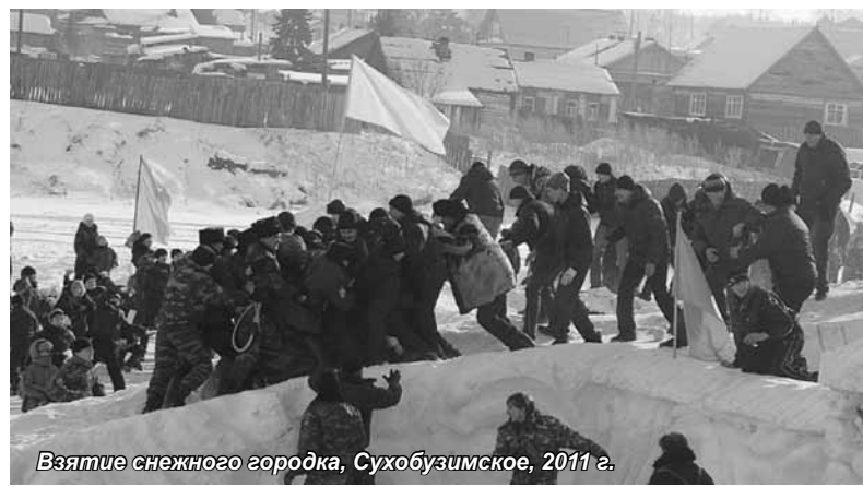
Взятие снежного городка, Сухобузимское, 2011 г.