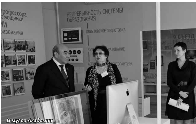
В музее Академии

быть успешно решены с помощью инструментов активной промышленной политики, направленной на технологическую модернизацию традиционных отраслей экономики, опережающее развитие обрабатыва-