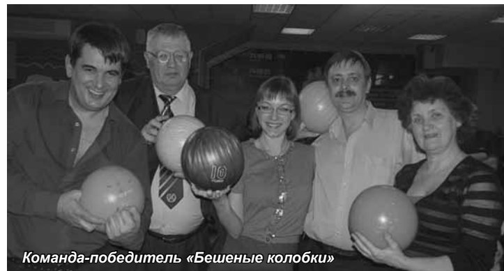
Команда-победитель «Бешеные колобки»