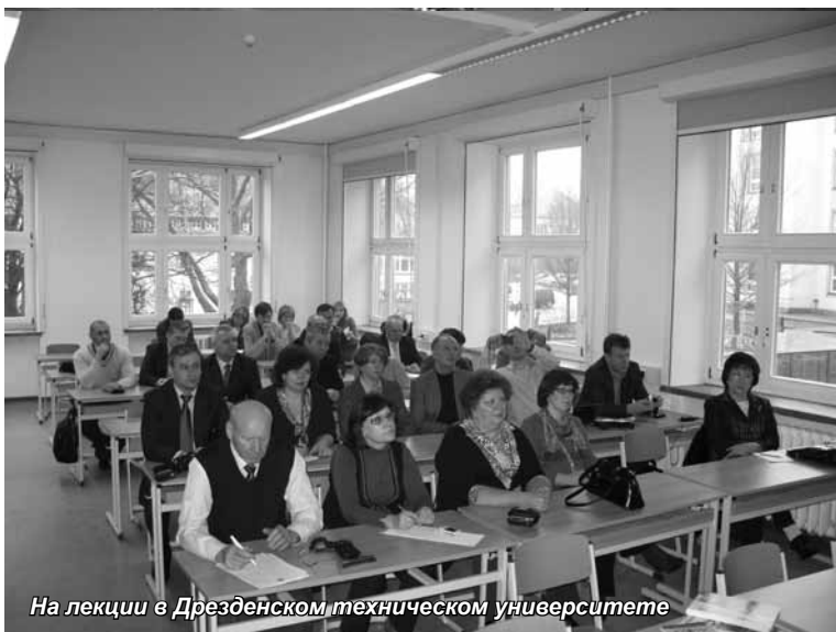
На лекции в Дрезденском техническом университете