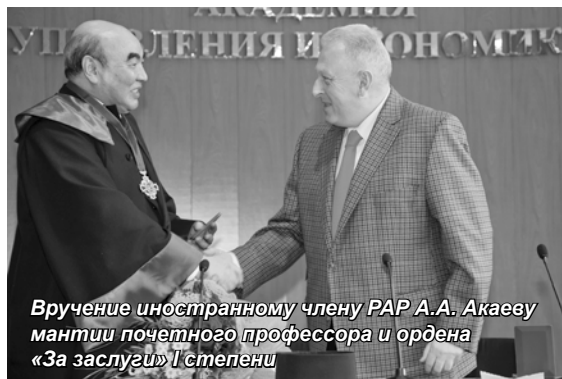
Вручение иностранному члену РАФ А.А. Акаеву мантии почетного профессора и ордена «За заслуги» I степени

А.А. Акаев давно является почетным профессором СПбАУЭ, и во время визита в Академию ему были вручены мантия и орден «За заслуги» I степени. С этого торжественного момента и началась встреча с профессорско-преподавательским составом, студентами вуза и приглашен-