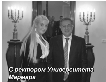
С ректором Университета Мармара

Открытое европейское образовательное пространство несет в себе бесчисленное множество перспектив. Согласно Болонскому процессу поощряется обучение студентов в зарубежных вузах, по крайней мере, в течение семестра. В связи с расширением Академией международных связей у студентов появилась возможность обучения за рубежом: в Финляндии, Китае, Германии и других странах. На нашей кафедре «Государственное и муниципальное управление» это обучение возможно в различных формах: участие в международных конференциях и симпозиумах, стажировки, обучение в магистратуре. Недавно был заключен договор о сотрудничестве между Государственным Университетом Мармара и нашей Академией, делегация вуза участвовала в Международном банковском симпозиуме в Стамбуле (Турция). Во время поездки было интересно пообщаться со студентами из