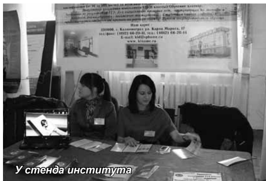
У стенда института

Наш стенд располагался в центре зала, был украшен красивым баннером и оборудован компьютером. На экране монитора постоянно прокручивались рекламные ролики о нашем институте и о головном вузе – Санкт-Петербургской академии управления и экономики. Интерес школьников был до-