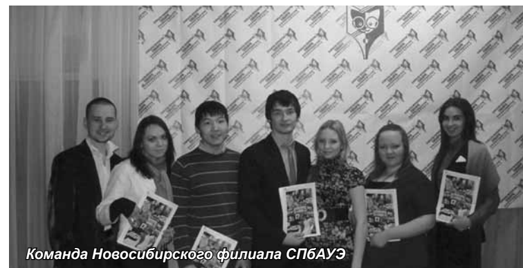
Команда Новосибирского филиала СПБАУЭ