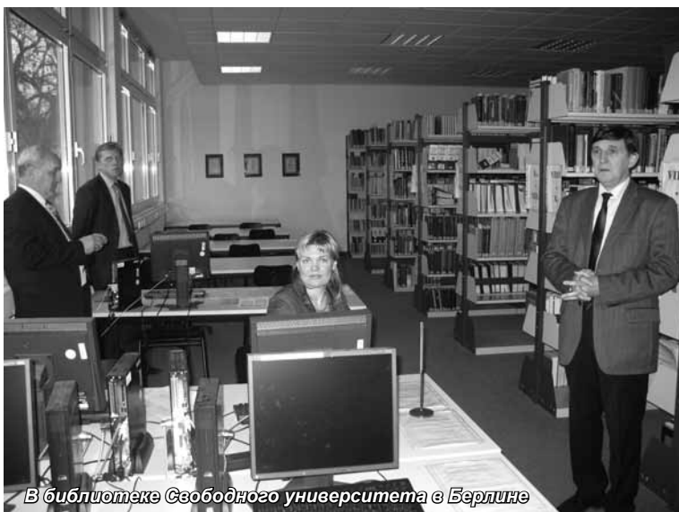
В библиотеке Свободного университета в Берлине

та им. Отто-фон-Герике П. Райхлинг, неизменный участник российско-германских семинаров по экономике, которые организует Санкт-Петербургская академия управления и экономики. В высших учебных заведениях, с которыми познакомились участники семинара, уже учатся студенты из Москвы, Петербурга и других городов, но их пока не так много. Во время пребывания делегации Санкт-Петербургской академии управления и экономики в Германии с представителями универси-