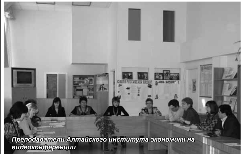
Преподаватели Алтайского института экономики на видеоконференции

Среди выступлений, прозвучавших на круглом столе, особый интерес у слушателей вызвал доклад к.филол.н., доцента Новосибирско-