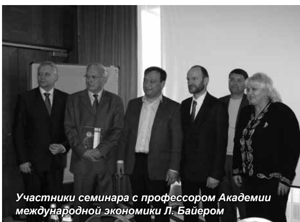
Участники семинара с профессором Академии международной экономики Л. Байером