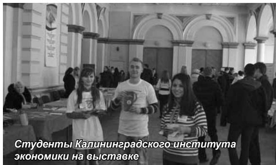
Студенты Калининградского института экономики на выставке

В конце февраля в Калининграде в городском Дворце творчества молодежи (Дворце культуры моряков) прошла очередная выставка-ярмарка вакансий и высших и средних профессиональных учебных заведений города. В работе выставке принял участие и Калининградский институт экономики.