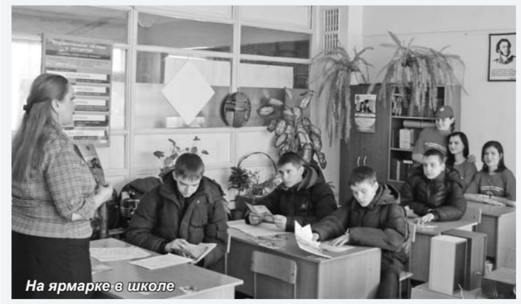
На ярмарке в школе

Информация Алтайского института экономики