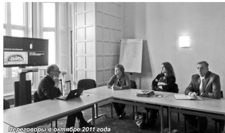
Переговоры в октябре 2011 года

В октябре 2011 года делегация Санкт-Петербургского университета управления и экономики посетила Университет Йорка в Англии с целью изучения опыта его работы. Во время визита велись переговоры о возможном сотрудничестве, в том числе в области проведения совместных научных разработок студентами и преподавателями. Первым опытом такого сотрудничества станет участие шести студентов нашего Университета в совместном учебном научно-исследовательском проекте СПбУЭУ и Школы менеджмента Университета Йорка.