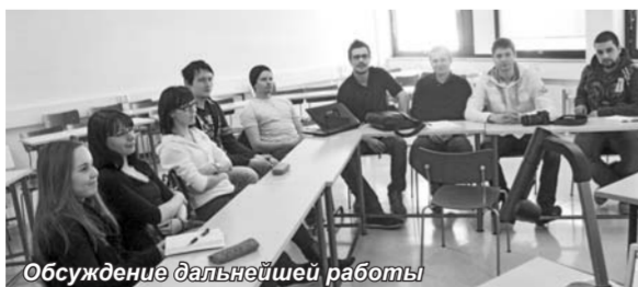
Обсуждение дальнейшей работы