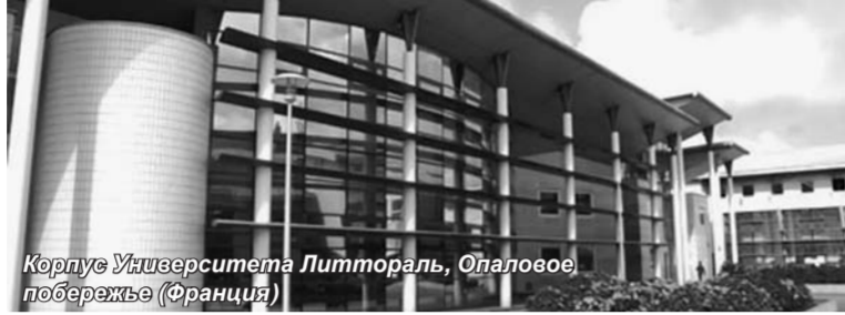
Корпус Университета Литтораль, Опаловое побережье (Франция)

У студентов Санкт-Петербургского университета управления и экономики появились новые возможности не только обучаться за рубежом, но и получить двойные дипломы – СПбУУЭ и вуза-партнера.