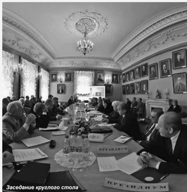
Заседание круглого стола