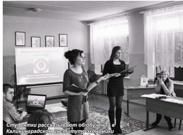
Студентки рассказывают об обучении в Калининградской школе экономики

Успешность будущей профессиональной деятельности во многом зависит от правильности выбранного пути: от осознанного выбора выпускником школы направлений бакалавриата, понимания того, кем он станет по окончании вуза. Этим и другим образовательным вопросам была посвящена состоявшаяся 17 февраля в средней общеобразовательной школе поселка Озерки Гвардейского района Калининградской области межшкольная научная конференция в области профессионального самоопределения «Я и моя профессиональная карьера», в которой приняли участие школьники и студенты вузов.