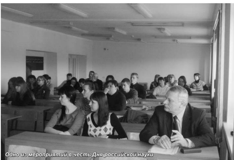
Одно из мероприятий в честь Дня российской науки