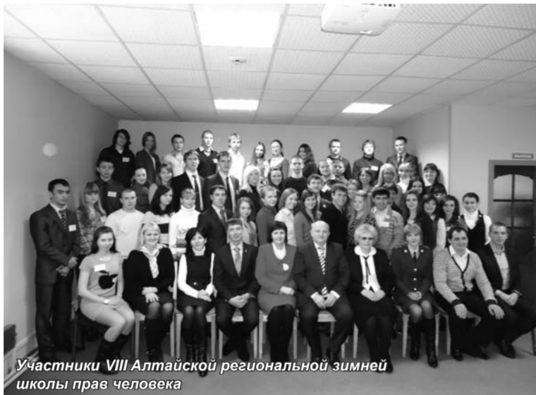
Участники VIII Алтайской региональной зимней школы прав человека