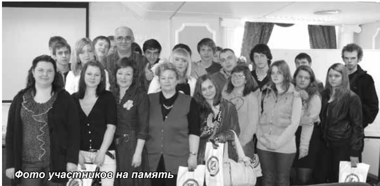
Фото участников на память

«Информационные технологии управления», «Информационная безопасность», «Мастер по обработке цифровой информации»... В настоящее время распространено мнение о том, что растет спрос на инженерные, IT-специальности и т.д., даже в условиях мирового финансово-экономического кризиса.