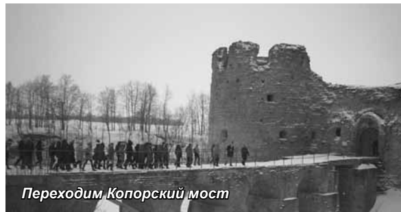
Переходим Копорский мост

Очередная автобусная поездка из экскурсионного цикла, организованного кафедрой «Туризм» состоялась 8 апреля. Маршрут экскурсии проходил по трем западным районам Ленинградской области: Ломоносовскому, Волосовскому и Кингисеппскому.