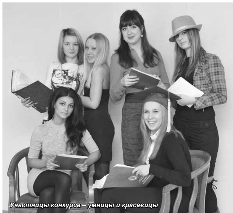
Участницы конкурса – умницы и красавицы

Целую неделю про конкурс и его участниц рассказывали все теле- и радиоканалы, писали газеты и даже показывали ролики в маршрутных такси. Сейчас студентки уже успокоились, выспались и с удвоенной силой принялись за учебу – летняя сессия