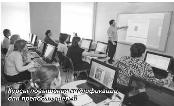
Курсы повышения квалификации для преподавателей

Воплощению в жизнь новых проектов и расширению кругозора коллектива Института способствует участие