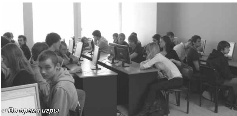
Во время игры