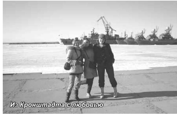
Из Кронштадта с любовью

Автобусная экскурсия по Курортному району Санкт-Петербурга для студентов, сотрудников, абитуриентов Университета была организована 1 апреля кафедрой «Туризм». Уникальность состоявшейся экскурсии заключается в том, что ее участники смогли