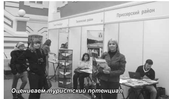
Оцениваем туристский потенциал

праздники, проводятся фестивали, выставки-ярмарки народных промыслов и ремесленничества, смотры художественной самодельности, театрализованные постановки. Правительство Ленинградской области рассматривает развитие