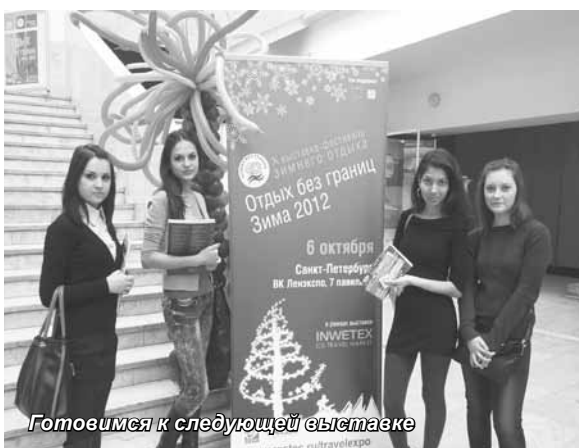
Готовимся к следующей выставке

Важнейшим событием весны 2012 г. для многотысячной армии работников туриндустрии и миллионов потенциальных туристов стала ежегодная, в этом году – XVI Международная туристская выставка «Отдых без границ. Лето 2012», работавшая с 5 по 8 апреля в ЦВЗ «Манеж». Более 200 компаний из России, Белоруссии, Украины, Хорватии, Кипра, Болгарии, Италии, Норвегии, Турции, Эстонии, Латвии, Литвы, Португалии, Финляндии, Венгрии, Иордании и Аргентины представили варианты летнего отдыха.