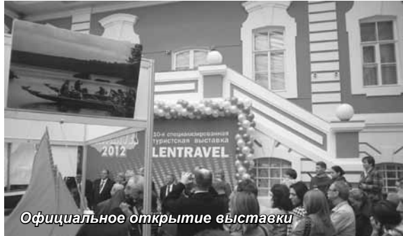
Официальное открытие выставки

В конце марта в Петропавловской крепости прошла X Ленинградская областная туристская выставка «LENTRAVEL-2012», на которой были представлены рекреационные возможности и туристические объекты Северо-Запада России. Организатором выставки выступил Комитет по физической культуре, спорту и туризму Ленинградской области. В выставоч-