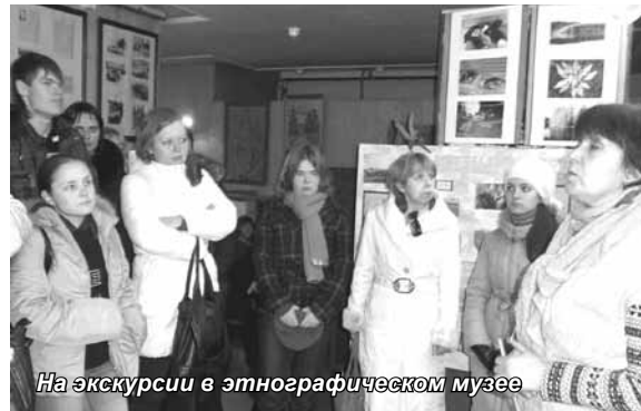
На экскурсии в этнографическом музее

Само название района определяет его назначение – курорт. Ведущее положение в инфраструктуре занимает