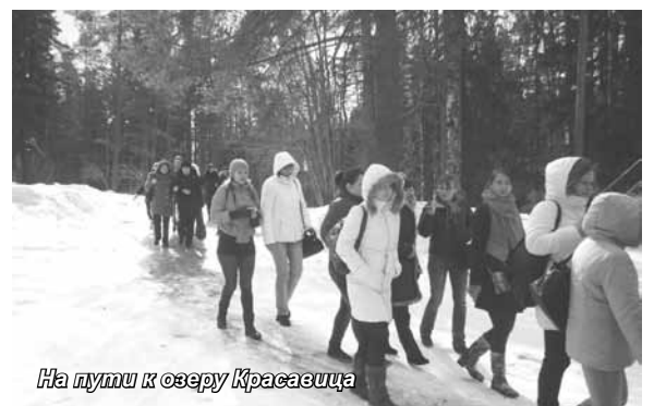
На пути к озеру Красавица

Маршрут экскурсии позволили проехать и по участку комплекса защитных сооружений Петербурга, именуемого петербуржцами дамбой. Дамба представляет собой интересный экскурсионный объект. С нее хо-