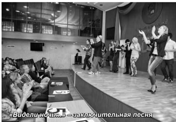
«Видели ночь...» – заключительная песня