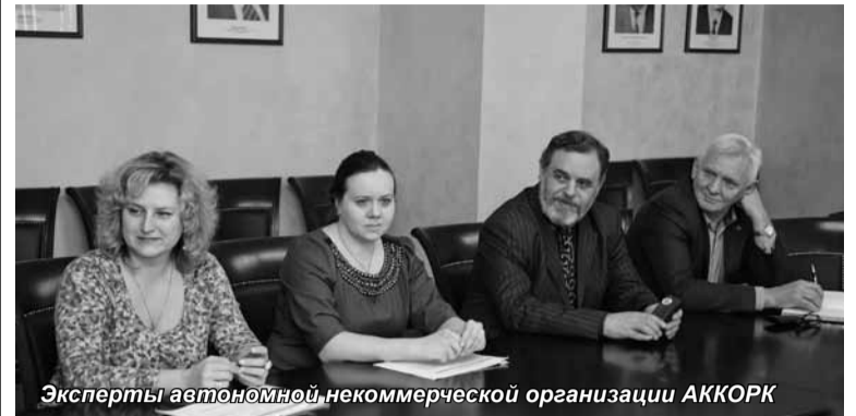
Эксперты автономной некоммерческой организации АККОРК

Со 2 по 3 мая в Санкт-Петербургском университете управления и экономики проводилась общественно-профессиональная аккредитация.