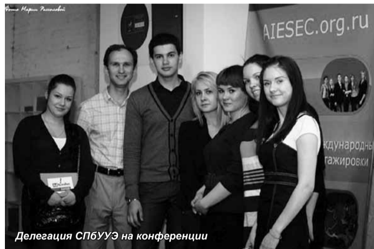
Делегация СПбУЭ на конференции

III Всероссийская конференция по альтернативной рекламе AdBreaker состоялась 19 мая по адресу Курляндская, 49. Студенты 1 и 2 курса специальности «Связи с общественностью» в сопровождении доцента Н.Г. Пряхина представляли на данном мероприятии наш Университет.