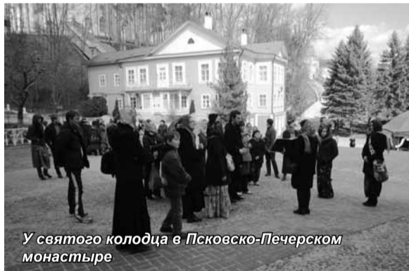
У святого колодца в Псковско-Печерском монастыре

В цикле экскурсионных поездок, организуемых кафедрой «Туризм», поездка по территории Псковской области традиционно вызывает интерес у студентов и сотрудников Университета.