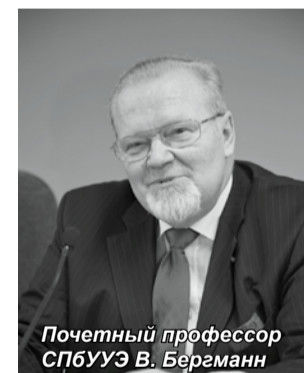
Почетный профессор СПБУЭУ В. Бергманн

с ним развитие сотрудничества России с Европейским Союзом. Базовые области – это экономика, право, здравоохранение, технические науки. На перспективу, что особенно актуально для сегодняшней молодежи, г-н Бергманн предлагает подумать о сотрудничестве в такой