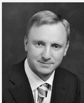
Дмитрий Викторович Ливанов родился 15 февраля 1967 года в Москве.

По сообщениям агентств «Газета.Ру», РБК, материалам «Российской газеты»