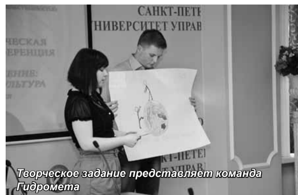
Теоретическое задание представляет команда Гидромета

Затем на пленарном заседании выступали с докладами студенты и