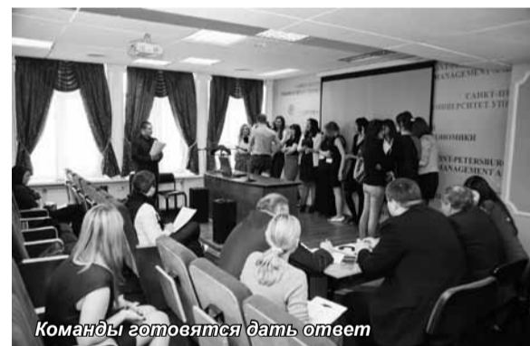
Команды готовятся дать ответ

за минуту одного из членов жюри поступать именно в тот вуз, который представляет команда. А уж дать интерпретацию известных высказываний: «Нам не дано предугадать, как слово наше отзовется...» Ф.И. Тютчева