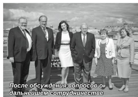
После обсуждения вопросов о дальнейшем сотрудничестве