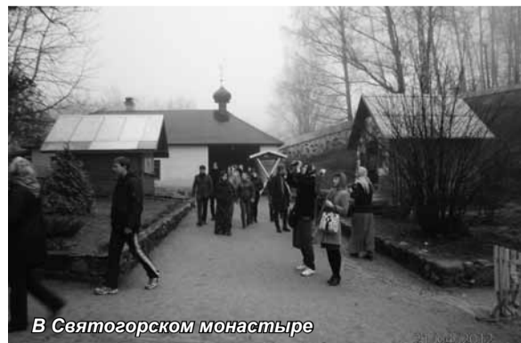
В Святогорском монастыре

Для студентов, получающих образование в туристской сфере деятельности, экскурсионные поездки являются учебными. Обучающиеся смогли убедиться, что Псковская область обладает богатым природно-ресурсным потенциалом. Наличие большого количества водных ресурсов, в том числе и минеральных вод благоприятно сказывается на организации туризма и отдыха различных видов. Область обладает благоприятными ландшафтами, в том числе и запознанными. По своим рекреационным качествам Псковская земля может быть отнесена к высшей категории. Варяжский князь Игорь, переправлявшийся здесь