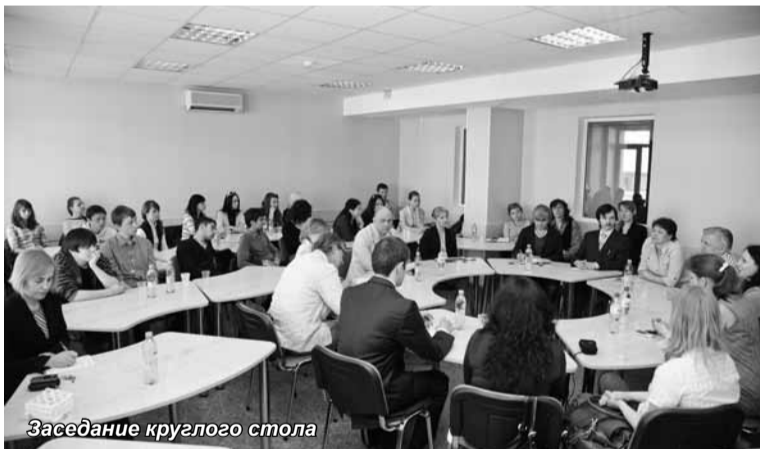
Заседание круглого стола

Круглый стол на тему «Роль языкового общения в формировании толерантного мышления» состоялся в СПбУУЭ 25 мая.