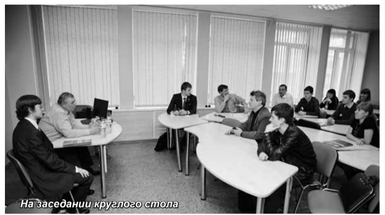
На заседании круглого стола

После пленарного заседания состоялись заседания круглых столов: