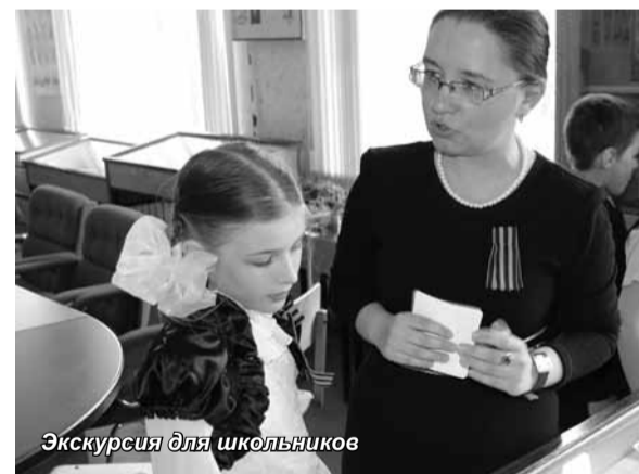
Экскурсия для школьников

В конференц-зале для них был показан фильм о филиале. Особенно ребятам понрави-