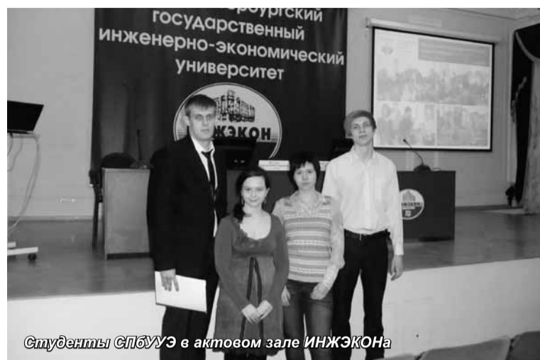
Студенты СПбУЭ в актовом зале ИНЖЭКОНа

V научный конгресс студентов и аспирантов прошел 25–26 апреля в Санкт-Петербургском государственном инженерно-экономическом университете (ИНЖЭКОН).