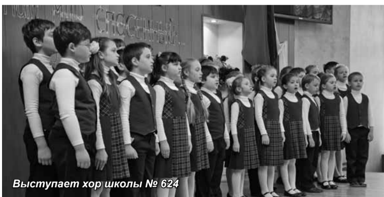
Выступает хор школы № 624

В преддверии 67-й годовщины Победы в Великой Отечественной войне в Санкт-Петербургском университете управления и экономики состоялось торжественное собрание.