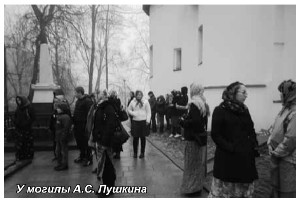
У могилы А.С. Пушкина

основателя Словена, сына первого новгородского посадника Гостомысла, и назывался Словенском. Позднее же он был переименован в честь сына Словена – Избора, погибшего от укуса змеи. Возможно, что свое название Изборск получил от слова «сбор», что когда-то означало место,