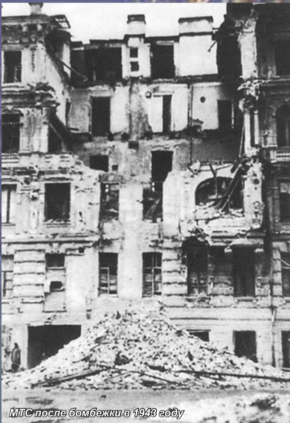
МТС после бомбежки в 1943 году

Она не считала это подвигом или самопожертвованием, говорила: «Им нужнее».