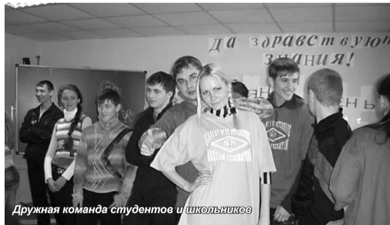
Дружная команда студентов и школьников