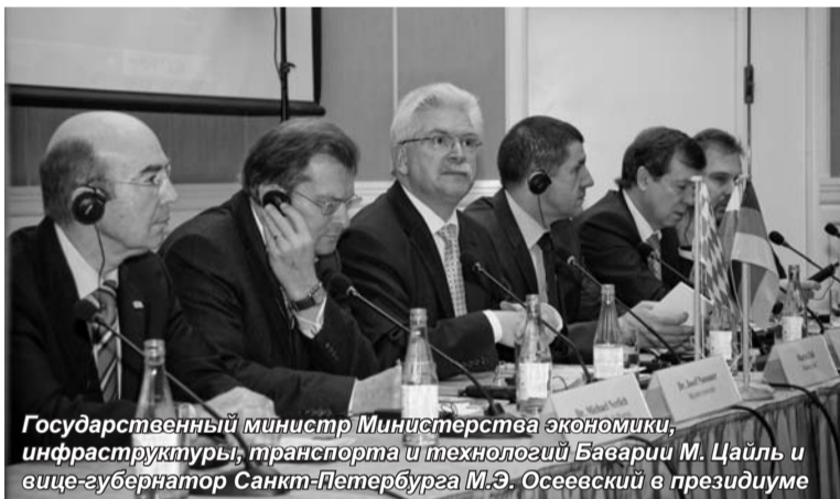
Государственный министр Министерства экономики, инфраструктуры, транспорта и технологий Баварии М. Цайль и вице-губернатор Санкт-Петербурга М.Э. Осеевский в президиуме

Открыл конференцию вице-губернатор Санкт-Петербурга, почетный профессор СПбАУЭ М.Э. Осеевский, который выразил надежду, что в дальнейшем между Санкт-Петербургом и Баварией завяжутся крепкие деловые отношения. В рамках конференции обсуждались проблемы развития автомобильной промышленности, медицинской техники, систем управления транспортом и