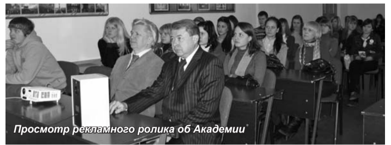
Просмотр рекламного ролика об Академии