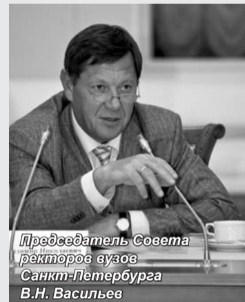
Председатель Совета ректоров вузов Санкт-Петербурга В.Н. Васильев