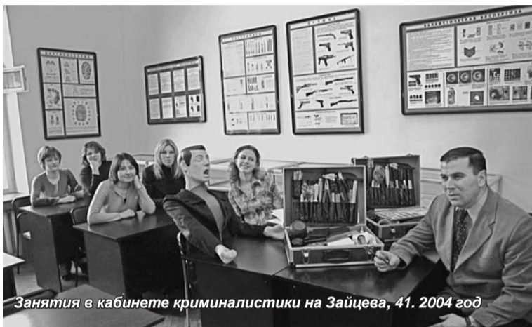
Занятия в кабинете криминалистики на Зайцева, 41. 2004 год

Преподавание ведут высококвалифицированные педагоги, имеющие большой педагогический, практический опыт и юридическую научную подготовку. Среди них 18 докторов наук, профессоров, 28 кандидатов