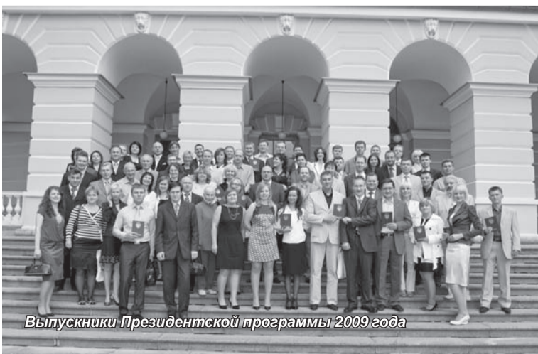
Выпускники Президентской программы 2009 года

Сотрудники Института переподготовки и повышения квалификации руководящих работников не собираются останавливаться на достигнутом. Коллектив этого подразделения Академии считает, что стоять на месте сегодня – это безнадежно отстать завтра. Поэтому у них всегда много планов, которые, несомненно, будут реализованы.