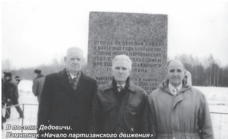
В поселке Дедовичи. Памятник «Начало партизанского движения»

В истории Великой Отечественной войны есть много событий и фактов, которые, безусловно, приблизили Советский Союз к победе над фашистами, но о которых известно не так много.