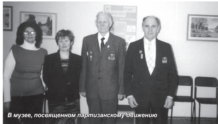
В музее, посвященном партизанскому движению

Подарки ваши - мы их не забудем; Вы жизнью рисковали, их везя. Спасибо вам! Где есть такие люди - Такую землю покорить нельзя.