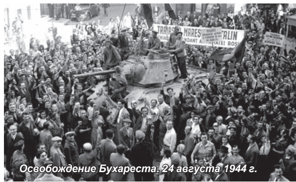
Освобождение Бухареста. 24 августа 1944 г.

хословакии было заключено соглашение об отношении между советским Главнокомандующим и чехословацкой административной после вступления советских войск на территорию Чехословакии. В одной из статей этого соглашения говорилось: «Как только