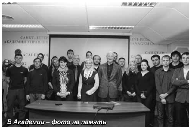
В Академии – фото на память

Обучение в Университете ориентировано на будущую профессию, особое внимание уделяется практике. В этом студенты Санкт-Петербургской академии управления и экономики убедились, посетив во время визита в Германию одну из мощнейших в стране металлургических корпораций SMS Siemag, которая также находится в Зигене. Ее специалисты разработа-