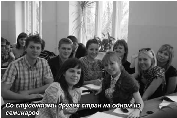
Со студентами других стран на одном из семинаров

ме 1 кредита ECTS по следующим пройденным программам: «Анализ проблем и тенденций развития мирового рынка финансовых услуг»; «Рынок банковских услуг: новые банковские продукты посткризисного периода»; «Методы фундаментального анализа послекризисного развития мировых валютных рынков»; «Стратегия