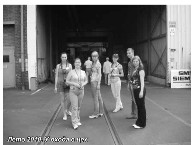
Лето 2010. У входа в цех