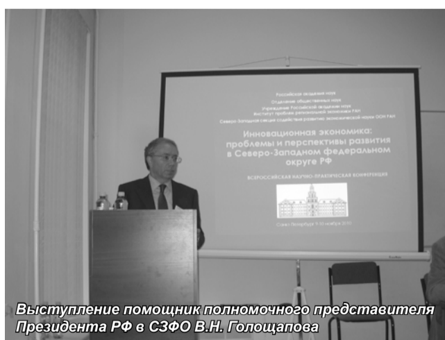
Выступление помощник полномочного представителя Президента РФ в СЗФО В.Н. Голощапова

которая состоялась с 9 по 10 ноября в Санкт-Петербурге.