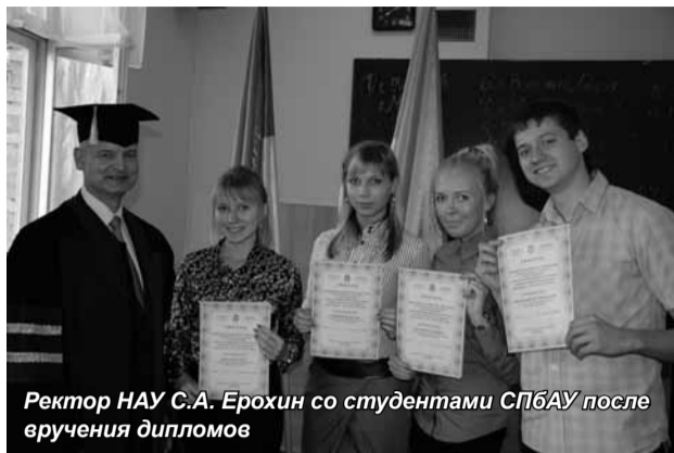
Ректор НАУ С.А. Ерохин со студентами СПбАУ после вручения дипломов

С 8 по 13 ноября состоялась поездка делегации Санкт-Петербургской академии управления и экономики в Киев, в Национальную академию управления на Международную осеннюю студенческую школу по теме «Анализ развития финансовых рынков в краткосрочной и долгосрочной перспективе – 2012 – 2015 – 2020 годы».