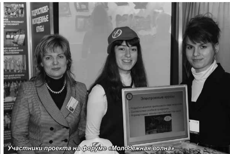
Участники проекта на форуме «Молодежная волна»