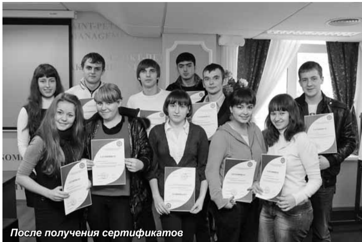
После получения сертификатов

Всем, кто является студентом, или когда-либо был им, известно, что самоорганизация - сложнейшая вещь. Курс «Студент в среде e-learning» проверил не только готовность студентов к работе в электронной среде, но и их способность к самоорганизации. Прежде чем сделать выводы, напомним о проекте. В начале этого учебного года у студентов первого курса появилась возможность научиться работать в системе дистанционного обучения «HyperMethod». Специалистами ИРВДТИО была подготовлена электронная среда для индивидуальной работы каждого учащегося. Таким образом, планировалось не только дать студентам основы e-learning, но и настроить их на самостоятельную работу. Состоялось всего две очные встречи: на