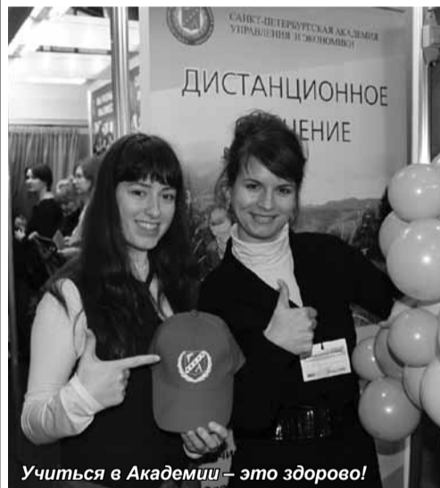
Учиться в Академии - это здорово!