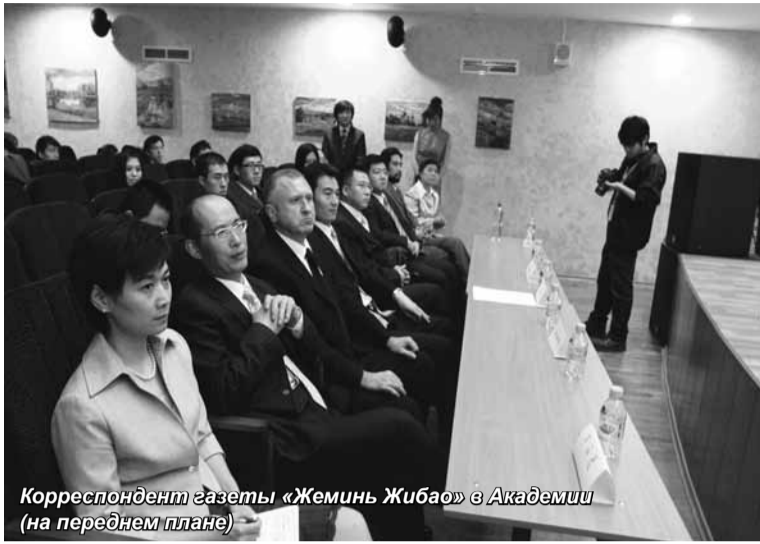
Корреспондент газеты «Жеминь Жибао» в Академии (на переднем плане)