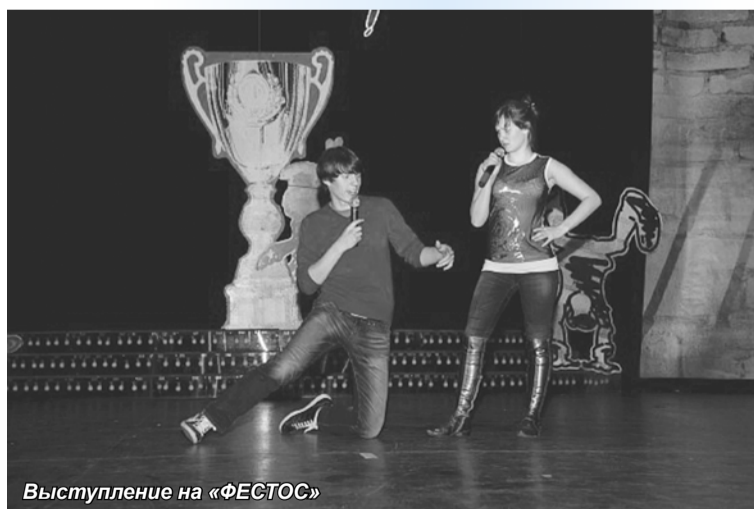
Выступление на «ФЕСТОС»

22 ноября - расширенное заседание старостата.