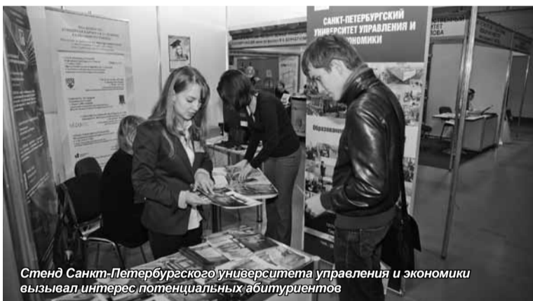
Стенд Санкт-Петербургского университета управления и экономики вызвал интерес потенциальных абитуриентов

Санкт-Петербургский университет управления и экономики принял участие в VIII Санкт-Петербургской международной выставке «Образование и карьера», которая состоялась 23-24 ноября в выставочном комплексе «ЛЕНЭКСПО».