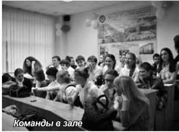
Команды в зале

Очевидно, что задачу подготовки молодого человека к успешной социализации в обществе не решить в рамках одного школьного урока, и такая задача не под силу одному учителю, и даже одному образовательному учреждению. Развивать необходимые для будущей успешной профессиональной карьеры компетенции и формировать экономическое мышление необходимо в условиях непрерывного образовательного процесса, в учебном комплексе «школа – вуз».