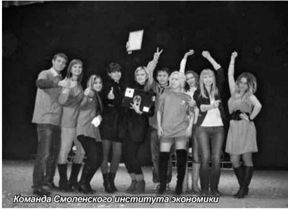
Команда Смоленского института экономики

Этой осенью команда студентов Смоленского института экономики внесла еще одну победу в список достижений института. Среди команд-участниц 11 высших учебных заведений Смоленска наша команда – «Партия активной молодежи» (ПАМ) заняла II почетное место в деловой игре «Мой выбор – 2012». Мероприятие проводилось с целью повышения политической активности молодежи, ее правовой грамотности и гражданского самосознания посредством участия команд в предвыборной кампании в качестве политических партий. Организаторами игры выступили Избирательная комиссия Смоленской области, а также Комитет по местному самоуправлению Администрации города Смоленска. На игру в качестве наблюдателей были приглашены