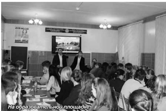
На образовательной площадке

В современных условиях одним из ключевых факторов развития экономики выступают инновации. Инновационная деятельность является основополагающей для обеспечения развития экономики индустриальных стран. Общеизвестно, что инновации позволяют быть первыми в жесткой экономической конкуренции на мировых рынках и получать солидные финансовые дивиденды на базе новых продуктов и новых технологий.