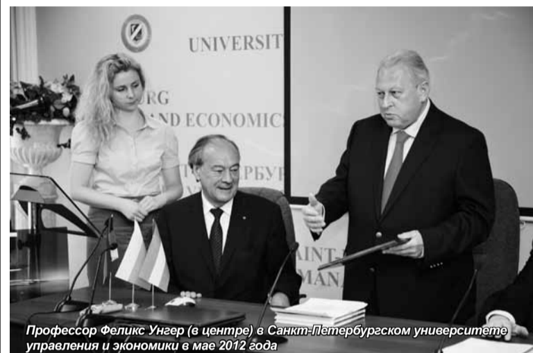
Профессор Феликс Унгер (в центре) в Санкт-Петербургском университете управления и экономики в мае 2012 года