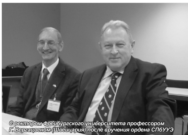
С ректором Фрейбургского университета профессором Г. Верагценом (Швейцария) после вручения ордена СПбУЭ

Ректор Санкт-Петербургского университета управления и экономики, профессор В.А. Гневко по приглашению Российской Академии об-