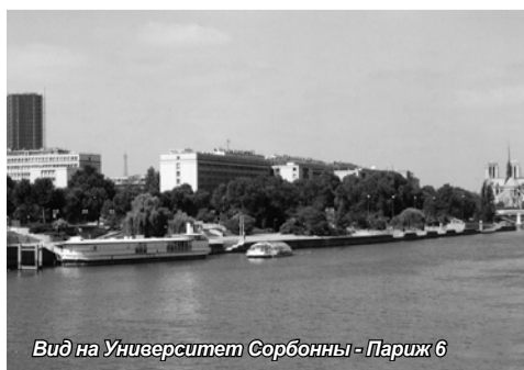
Вид на Университет Сорбонны - Париж 6

Состоялся также визит в крупнейшую в мире лабора-