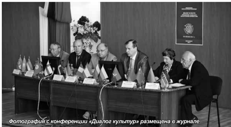
Фотография с конференции «Диалог культур» размещена в журнале