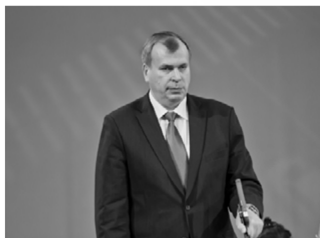
Газета «Менеджер» № 13-14, 30 августа

Председатель Комитета по науке и высшей школе Правительства Санкт-Петербурга А.С. Максимов поздравил первокурсников от имени губернатора Санкт-Петербурга Г.С. Полтавченко. «Вы сделали правильный, осознанный выбор», – отметил А.С. Максимов. – Данный Университет всего добивается благодаря таланту своих преподавателей и своим студентам». Он также особо подчеркнул, что быть студентом – это значит не только учиться, но и занимать активную жизненную позицию.