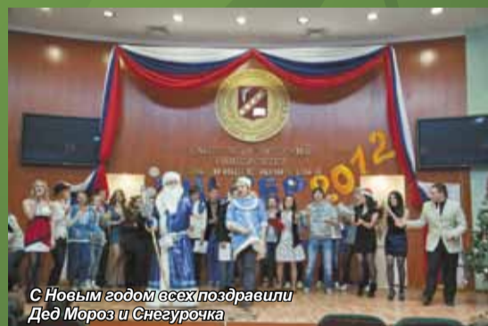
С Новым годом всех поздравили Дед Мороз и Снегурочка

Заключительный конкурс – творческий. Это выступление каждый участник готовил самым тщатель-