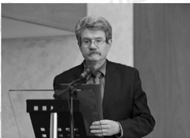
Газета «Менеджер» № 8, 28 апреля