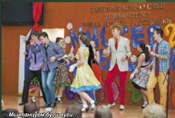
Мы танцуем буги-вуги...

Незадолго до Нового года студенты Санкт-Петербургского университета управления и экономики решили преподнести всем сюрприз – подарить веселый праздник. И 21 декабря провели традиционный конкурс «Мистер Первокурсник».