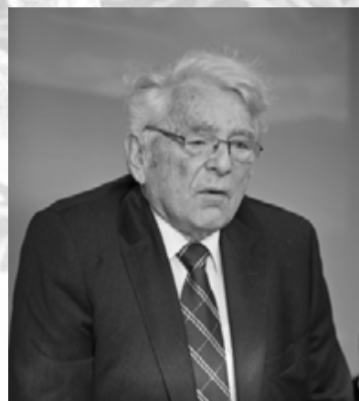
Газета «Менеджер» № 21, 17 декабря