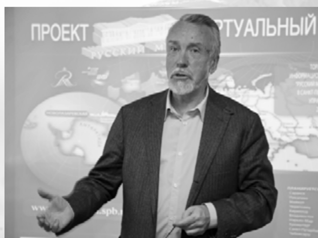
Газета «Менеджер» № 4, 7 марта

«Мы благодарны вам за интерес к нашему проекту, – сказал на открытии в СПбУУЭ виртуального филиала Русского музея его директор В.А. Гусев. – Мне особенно приятно, что виртуальный филиал открывается сегодня именно в Санкт-Петербургском университете управления и экономики. Я являюсь его почетным профессором. Надеюсь, что этот проект будет полезен и вам, и нам».