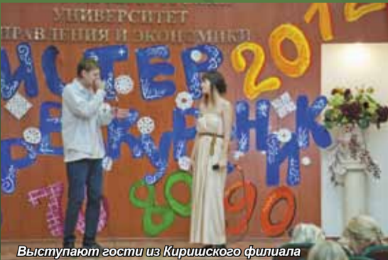
Выступают гости из Киришского филиала