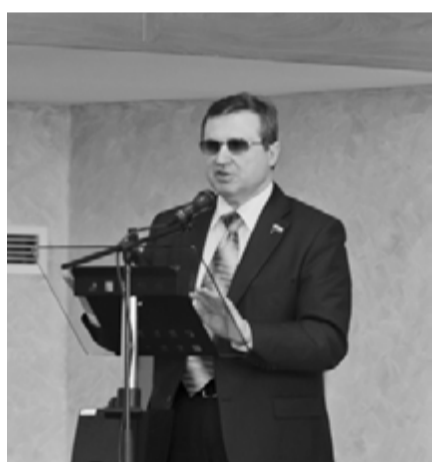
Газета «Менеджер» № 8, 28 апреля

Депутат Государственной думы РФ О.Г. Дмитриева на торжественной церемонии посвящения в студенты первокурсников Санкт-Петербургского университета управления и экономики говорила о том, как замечательно, что в вуз привлекаются лучшие профессора и педагоги. «Вы избрали очень хорошую профессию, я горжусь, что я – экономист. Именно от нас с вами зависит будущее страны, ее благополучие», – обратилась она к своим будущим коллегам.