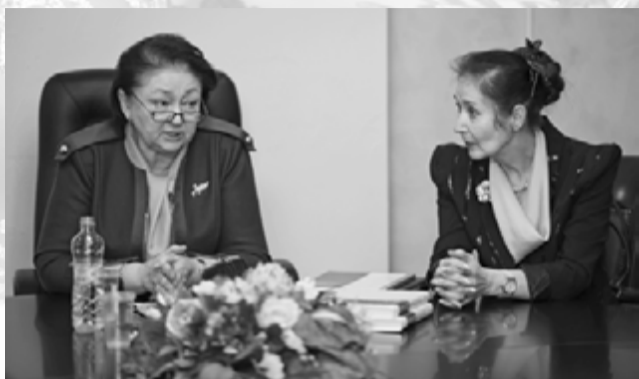
Газета «Менеджер» № 18, 29 октября