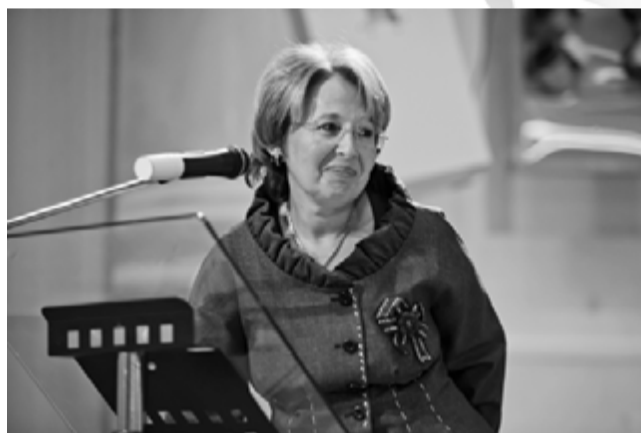
Газета «Менеджер» № 15, 17 сентября

Депутат Государственной думы РФ О.Г. Дмитриева на торжественной церемонии посвящения в студенты первокурсников Санкт-Петербургского университета управления и экономики говорила о том, как замечательно, что в вуз привлекаются лучшие профессора и педагоги. «Вы избрали очень хорошую профессию, я горжусь, что я – экономист. Именно от нас с вами зависит будущее страны, ее благополучие», – обратилась она к своим будущим коллегам.