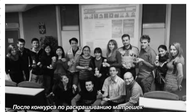
После конкурса по раскрашиванию матрешек