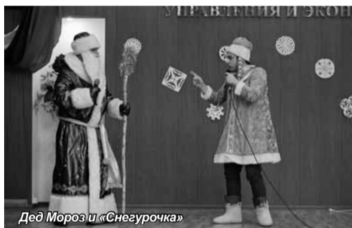
Дед Мороз и «Снегурочка»

Конец декабря 2013 года оказался для студентов Санкт-Петербургского университета управления и экономики очень насыщенным событиями. Это и неудивительно – накануне Нового года не только ждут чудес, но и стараются сотворить чудо для кого-то, кто в нем нуждается.