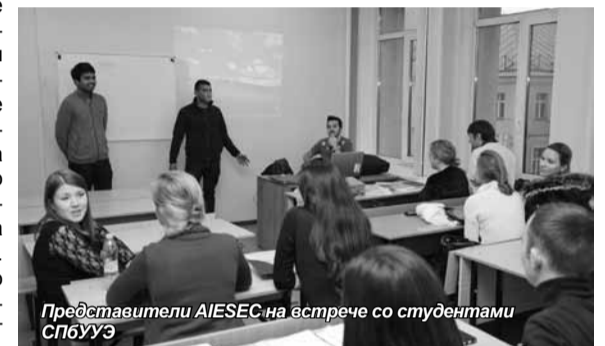
Представители AIESEC на встрече со студентами СПбУУЭ