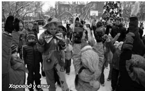
Хоровод у елки

«Праздник, организованный институтом для школьников