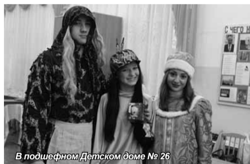
В подшефном Детском доме № 26

Студенты подготовили праздничный концерт, подарили всем заряд положительных эмоций и новогоднее настроение. Веселые песни и зажигательные танцы в их исполнении никого не оставили равнодушными. Конечно, с Новым годом всех поздравили Дед Мороз и Снегурочка.