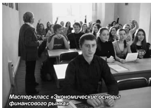
Мастер-класс «Экономические основы финансового рынка»

Мастер-класс для студентов колледжа Калининградского института экономики, посвященный основам организации страхового дела, был успешно проведен в сотрудничестве с тремя крупными страховыми компаниями региона – «Ренессанс-страхование», «ВСК-страховой дом» и «Альфа-страхование».