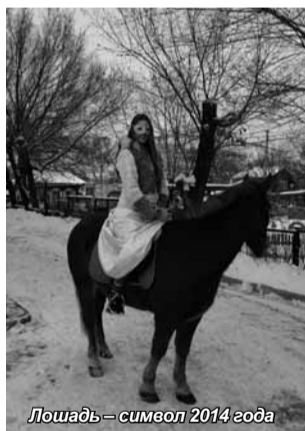
Лошадь – символ 2014 года

Красавица-елка встречала гостей на спортивной площадке, расположенной во дворе института. Снегурочка, Баба-Яга – чумаза, но с добрым сердцем, забавный клоун, разбойники, похитившие подарки, Снежинки, исполнившие танец с бенгальскими огнями, и другие сказочные персонажи – все эти роли сыграли студенты.