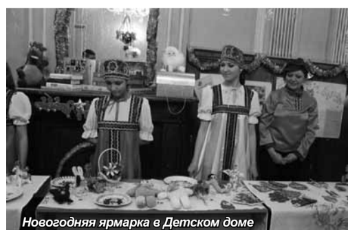
Новогодняя ярмарка в Детском доме