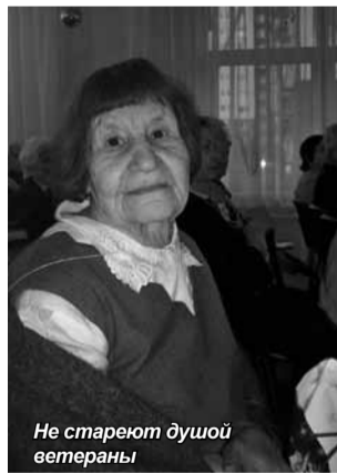
Не стареют душой ветераны

будет опубликован в региональной Книге памяти «Поклон Вам, солдаты Великой Победы».