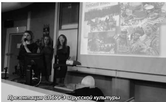
Презентация СПбУУЭ о русской культуре