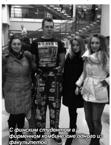
С финским студентом в фирменном комбинезоне одного из факультетов

Елена АБРАМОВА (Информация предоставлена отделом международного сотрудничества и академической мобильности СПбУУЭ)