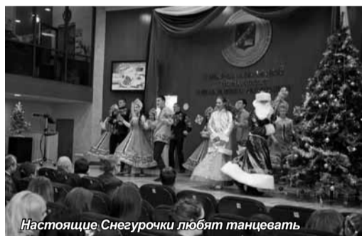
Настоящие Снегурочки любят танцевать

23 декабря с новогодними праздниками студенты поздравили ребят из подростково-молодежного клуба «Идеал».