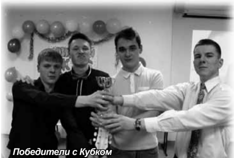
Победители с Кубком