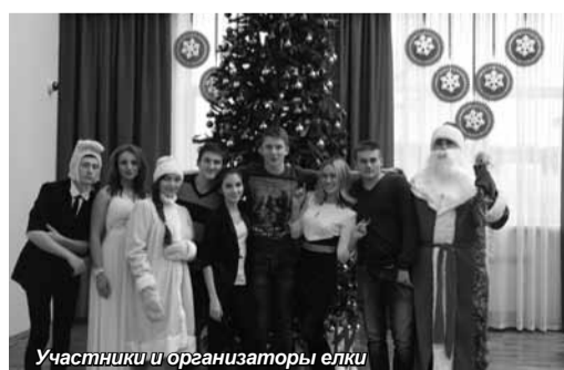
Участники и организаторы елки