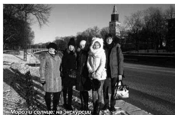
Мороз и солнце: на экскурсии