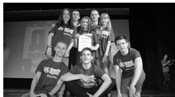
У девушками нашей команды соперники не устояли