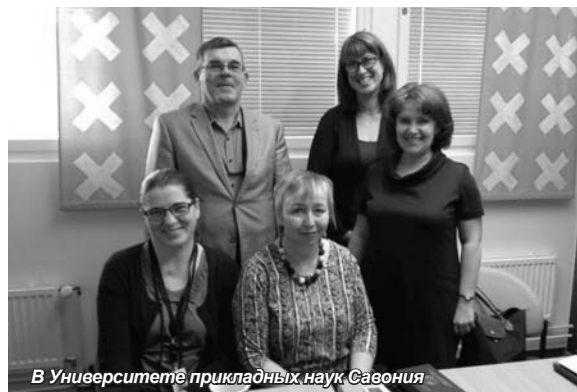
В Университете прикладных наук Савония

У Санкт-Петербургского университета управления и экономики обширные и авторитетные зарубежные связи, он сотрудничает с высшими учебными заведениями США, Франции, Великобритании, Германии, Италии, Испании, Финляндии, Норвегии и многих других стран мира. Одно из основных направлений сотрудничества – академический обмен студентами, организация обучения и стажировок за рубежом. Со многими вузами реализуются совместные образовательные программы, в результате чего студенты имеют возможность получить два диплома – СПбУУЭ и вуза-партнера.