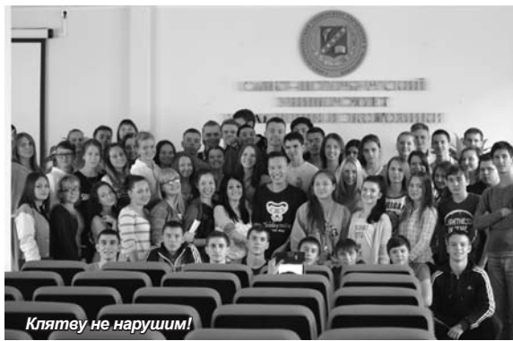
Клятву не нарушим!

Завершился праздник словами клятвы, в которой первокурсники пообеща-