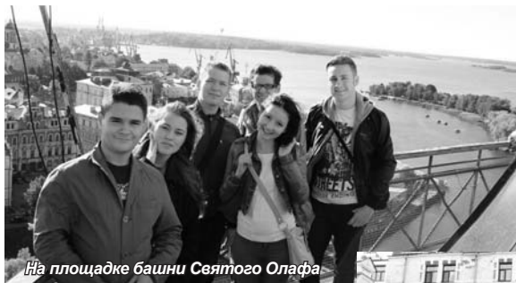
На площадке башни Святого Олафа

Группа студентов первого курса Института международных программ 13 сентября посетила г. Выборг.