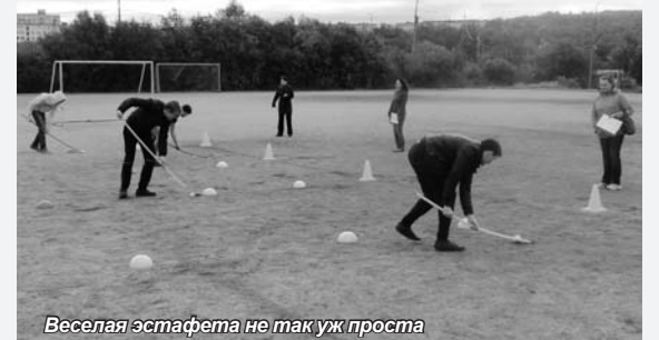
Веселая эстафета не так уж проста

Погода в этот день не подвела – было ясно и солнечно. Студенты-очники приняли участие в веселых спортивных конкурсах и состязаниях на стадионе, расположенном на Семеновском озере. Не отставали от студентов и преподаватели института, непосредственно принимавшие участие в состязаниях в качестве помощников главного судьи. После активного отдыха и соревнований ребят ждали награждение почетны-