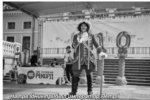
На праздник прибыл император Петр I

станциям, танцевальные флеш-мобы, катания на лодках, презентации клу-