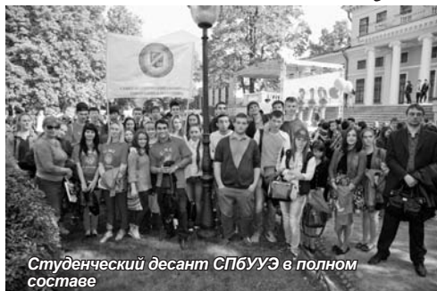
Студенческий десант СПбУУЭ в полном составе

В Юсуповском саду 17 сентября в десятый раз прошла акция «Здорово жить – здорово!», которая в этом году была приурочена к 310-летию Адмиралтейского района.