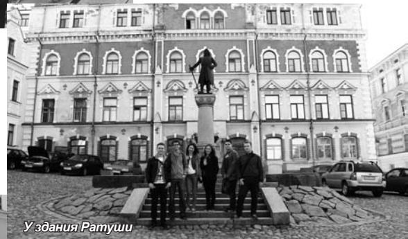
У здания Ратуши

Выборг – один из крупнейших и красивейших городов Ленинградской области, основан в Средние века шведами. В 1710 году город был взят русскими войсками и флотом, а по Ништадтскому мирному договору 1721