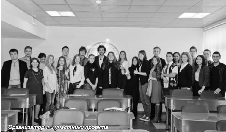
Организаторы и участники проекта