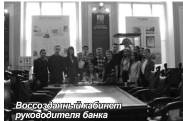
Воссозданный кабинет руководителя банка

банка того времени. Также экскурсовод рассказала о том, какие операции совершает Центробанк России сегодня, что за последние 15 лет было внедрено множество инноваций, и работа с монетами и банкнотами на данный момент полностью авто-