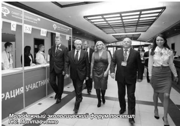
Молодежный экологический форум посетил Г.С. Полтавченко

Г.С. Полтавченко открыл экспериментальную площадку «Санкт-