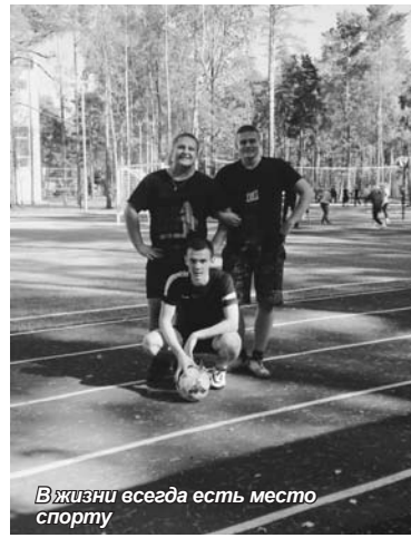
В жизни всегда есть место спорту

Два дня на форуме пролетели быстро, но это были радостные и насыщенные событиями дни, которые принесли не только новые знания, но и новые знакомства. Форум помог нам