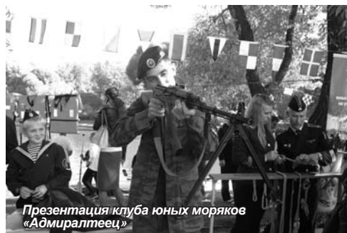
Презентация клуба юных моряков «Адмиралтеец»

Занятие по душе на празднике мог найти каждый – концерт, игры по