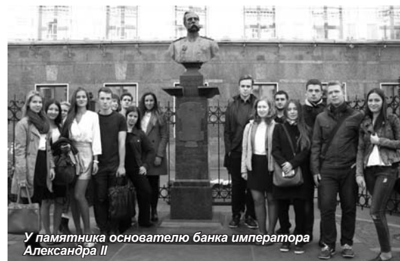
У памятника основателю банка императора Александра II