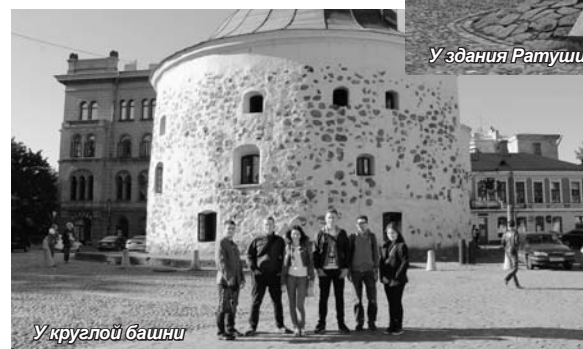
У крулой башни