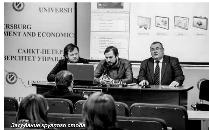
Заседание круглого стола