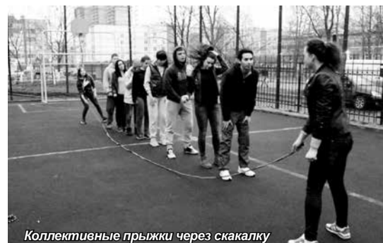
Коллективные прыжки через скакалку

лакомства – конфеты. А студенты будто и впрямь окунулись в детство – играли весело и с азартом, проявили сплочённость и продемонстрировали свою ловкость. По мнению участников встречи, наиболее интересной игрой был волейбол, все приятно и с пользой провели время.