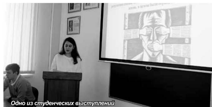
Одно из студенческих выступлений

Подведение итогов конференции сопровождалось не только теплыми словами организаторов этого яркого научного события, пожеланиями творческих успехов и креативных идей в научно-исследовательской деятельности, но и вручением наград победителям, а также дипломов, благодарственным писем и сертификатов всем участникам данного мероприятия.