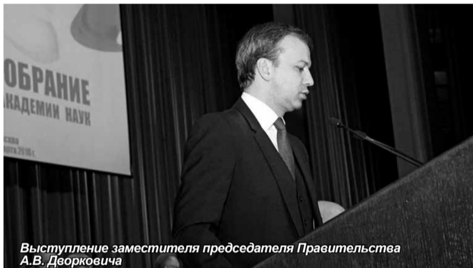
Выступление заместителя председателя Правительства А.В. Дворковича

Источники: http://profiok.com/about/news/detail.php?ID=3166#ixzz43v8NEkgX , http://argumenti.ru/society/n531/439907 , http://www.ras.ru/news/shownews.aspx?id=4e458ed5-fcef-448f-abb4-568dc806b2c0