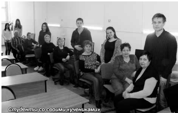
Студенты со своими «учениками»

В Рязанском институте экономики – филиале Санкт-Петербургского академического университета начался очередной этап реализации программы обучения рязанских пенсионеров основам компьютерной грамотности в рамках проекта «Университет третьего возраста» РПО ООО «Союз пенсионеров России», направленного на повышение качества жизни пожилых граждан и их адаптацию к современным условиям. Содействие в реализации проекта «Университет третьего возраста» Рязанский институт экономики оказывает отделе-