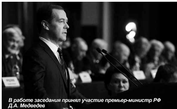
В работе заседания принял участие премьер-министр РФ Д.А. Медведев

В Академии обсудили научные результаты прошедшего года и наметили задачи на будущее