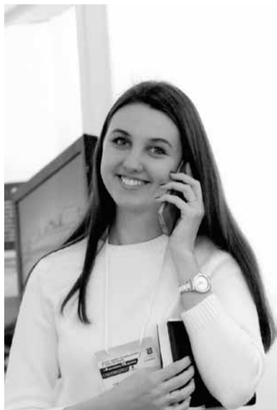
Беседовала Елена АБРАМОВА

Роль государственной поддержки в кризис резко возрастает. Правительство Санкт-Петербурга предлагает начинающим и действующим предпринимателям получить поддержку, которая поспособствует удержать рискованные проекты и перспективных заказчиков. Бесплатную помощь свои клиентам предлагает государственный «Центр развития и поддержки предпринимательства» (СПб ГБУ «ЦРПП»): проводит консультирование начинающих и действующих предпринимателей по вопросам участия в специальных программах государственной поддержки, правовой поддержки в части открытия своего дела, финансовой и инфраструктурной поддержки, субконтрактингу и производственной кооперации, поддержки экспортно-ориентированных предприятий.