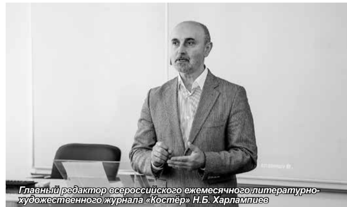
В семинаре приняли участие сотрудники издательства, корректоры-практики, преподаватели и студенты вузов