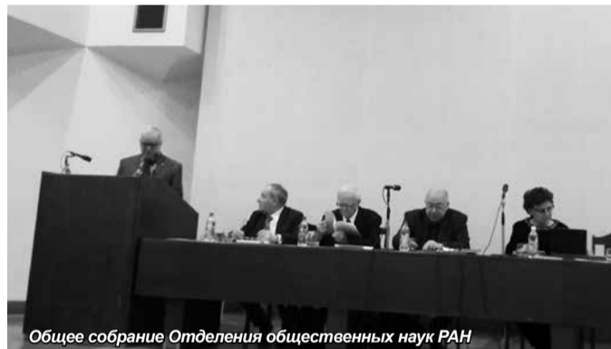
Общее собрание Отделения общественных наук РАН