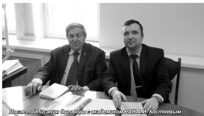
После подписания договора с академиком РАН А.И. Костяевым

В фонд библиотеки Санкт-Петербургского академического университета А.И. Костяев передал свою монографию «Территориальная дифференциация сельскохозяйственного производства: вопросы методологии и теории».