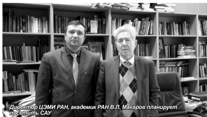
Директор ЦЭМИ РАН, академик РАН В.Л. Макаров планирует посетить САУ