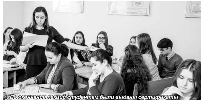
По окончании лекций студентам были выданы сертификаты