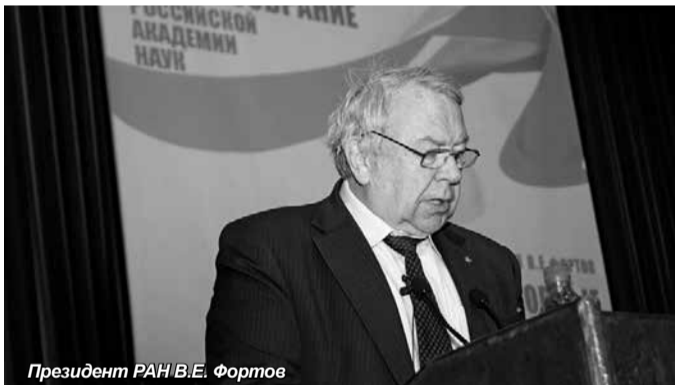
Президент РАН В.Е. Фортов