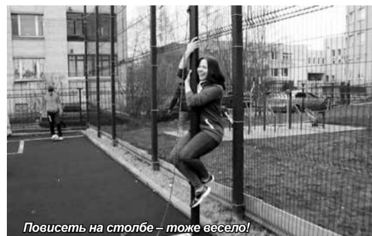
Повисеть на столбе – тоже весело!