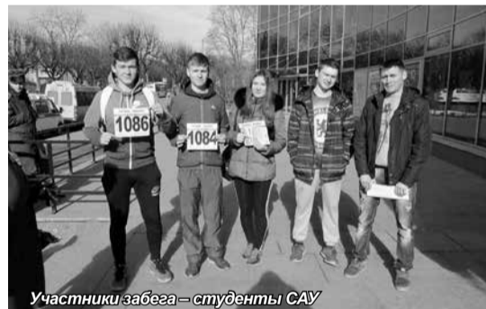
Участники забега – студенты САУ