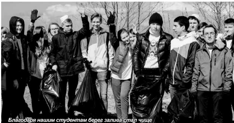
Благодаря нашим студентам берег залива стал чище

Международная экологическая акция объединила молодежь трех стран