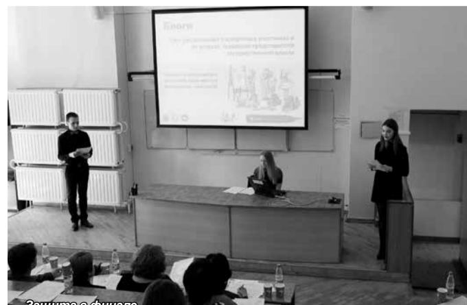
Защита в финале