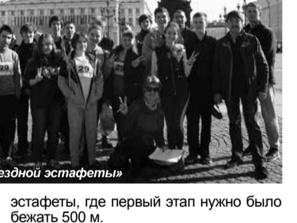
Перед стартом «Звездной эстафеты»

Достоинно, с энтузиазмом и азартом студенты Университета принимали участие и в 46-ой традиционной Кольцевой эстафете, также посвященной 71-ой годовщине Великой Победы и состоявшейся 16 апреля. Трасса была сложной, особенно на старте