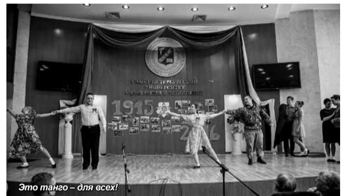
Это танго — для всех!