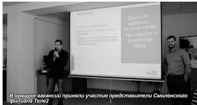
В ярмарке вакансий приняли участие представители Смоленского филиала Теле2

К слову, у ярмарок вакансий, в том числе и у первой весенней – молодое лицо. Заветрашние профессионалы ищут работу, подчас даже не успев получить диплом. Как известно, временная работа – один из путей к работе постоянной. И молодежь это хорошо понимает.