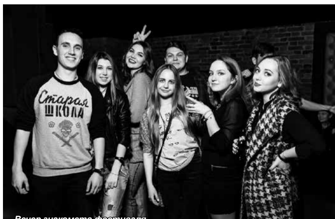
Вечер знакомств фестиваля

Спасибо ребятам за такую плодотворную работу и желаем им дальнейших успехов и совершенствования профессионального мастерства. Отдельной благодарности заслуживают организаторы XVI Всероссийского Фестиваля с международным участием «PR - профессия третьего тысячелетия» за столь прекрасный праздник и возможность участия.