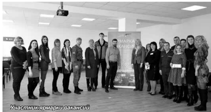
Участники ярмарки вакансий