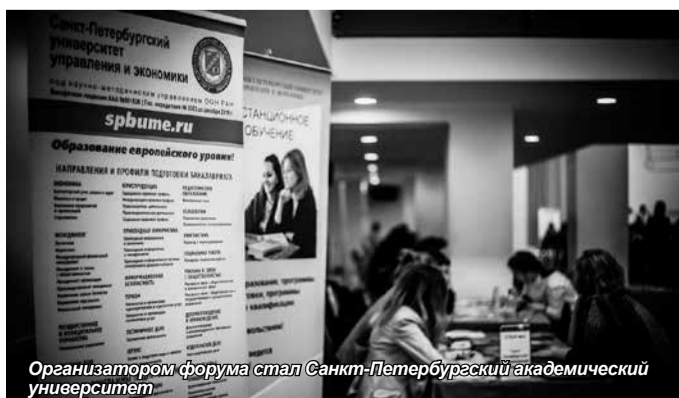
Организатором форума стал Санкт-Петербургский академический университет