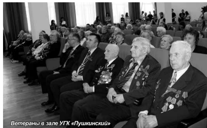
Ветераны в зале УГК «Пушкинский»