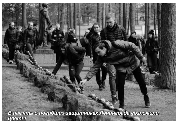
В память о погибших защитниках Ленинграда возложили цветы