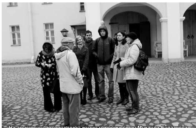
На экскурсии, посвященной жизни и творчеству Михаила Булгакова