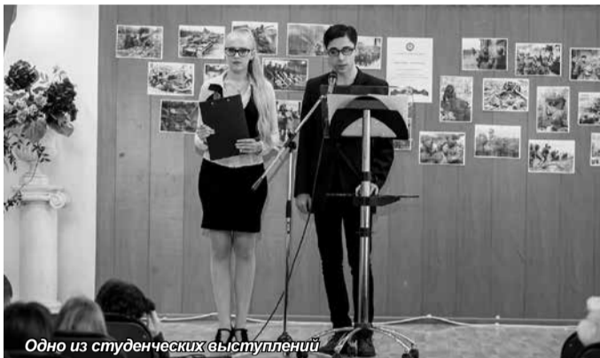
Одно из студенческих выступлений

Всем студентам – участникам конференции были вручены сертификаты.