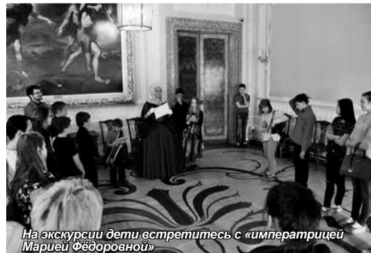
На экскурсии дети встретятся с императрицей Марией Фёдоровной