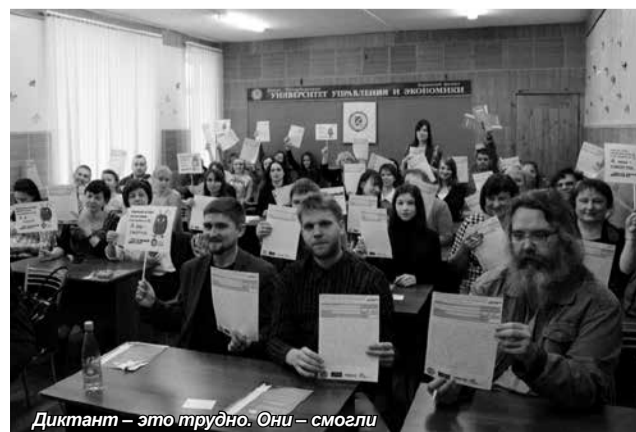
Диктант – это трудно. Они – смогли

Очень радует, что проведение в Киришах тотального диктанта именно в нашем филиале стало традиционным. Для его организации открываются аудитории, ставят-