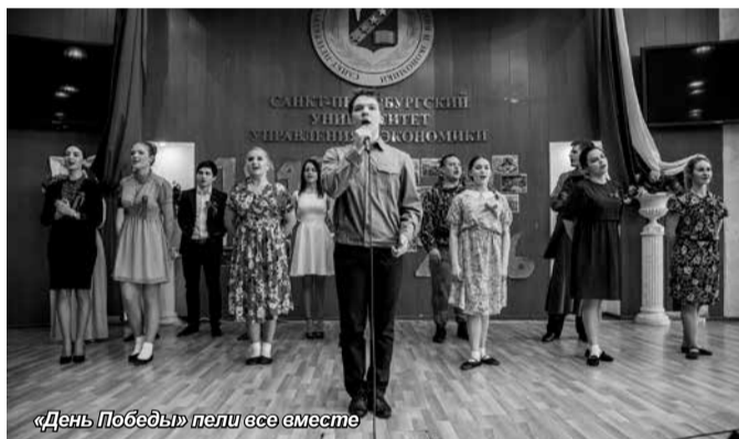
«День Победы» пели все вместе