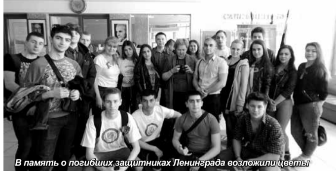
В память о погибших защитниках Ленинграда возложили цветы!

Прошли годы, но память о том, что на этой священной земле остались тысячи и тысячи наших соотечественников, не угаснет в наших сердцах никогда!