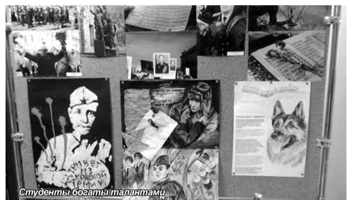
Студенты богаты талантами