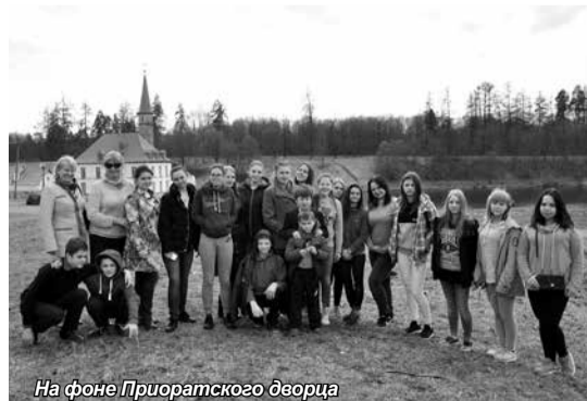
На фоне Приоратского дворца