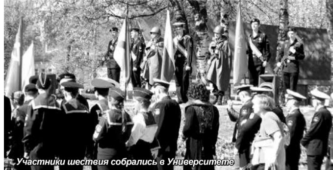
Участники шествия собрались в Университете