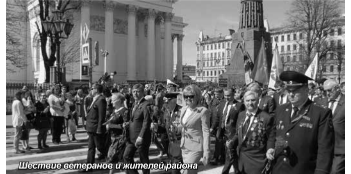
Шествие ветеранов и жителей района