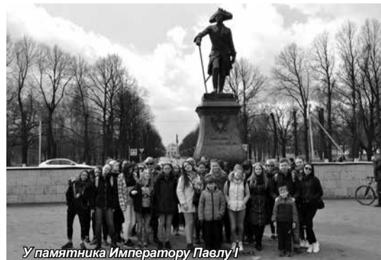
У памятника Императору Павлу I

Спасибо всем, кто принимал участие в благотворительной акции «Доброе сердце»!