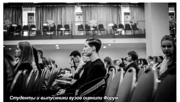
Студенты и выпускники вузов оценили Форум