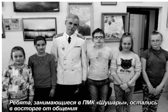
Ребята, занимающиеся в ПМК «Шушары», остались в восторге от общения