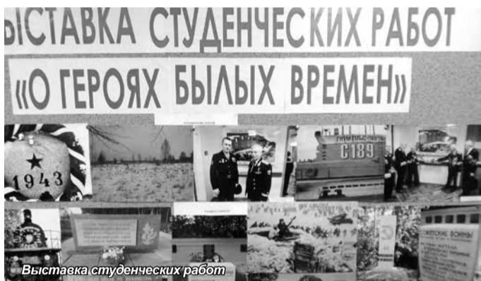
Выставка студенческих работ

Мы благодарим всех участников и надеемся на дальнейшее сотрудничество.