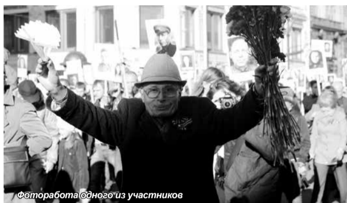
Фоторабота одного из участников