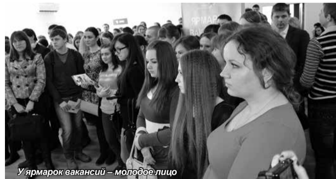
У ярмарок вакансий – молодое лицо