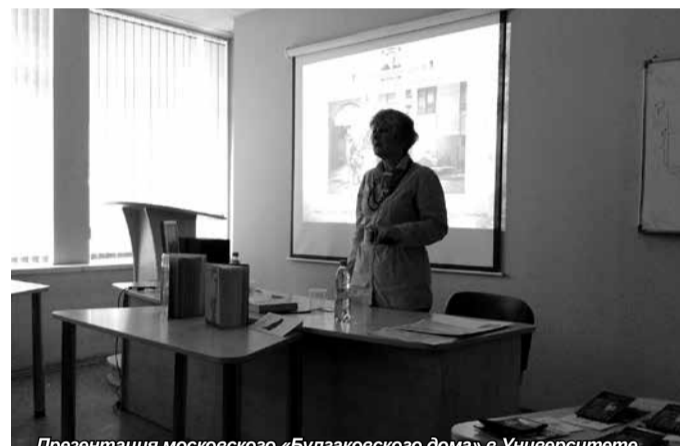
Презентация московского «Булгаковского дома» в Университете