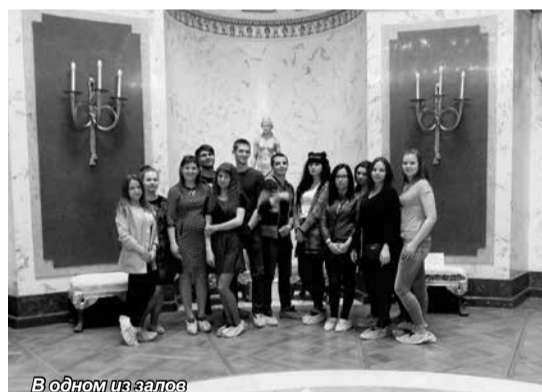
В одном из залов

Я надеюсь, что каждый из них, как и я, по-своему влюбился в Павловский парк, и теперь они будут приезжать чаще, показывая излюбленные места своим друзьям.