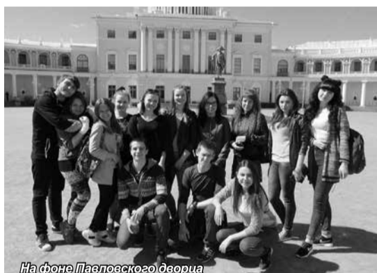
На фоне Павловского дворца