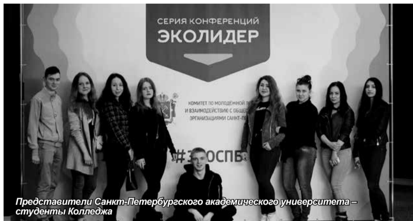
Представители Санкт-Петербургского академического университета – студенты Колледжа

Студенты Колледжа приняли участие в экологической конференции