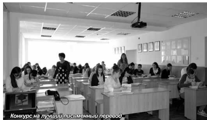
Конкурс на лучший письменный перевод