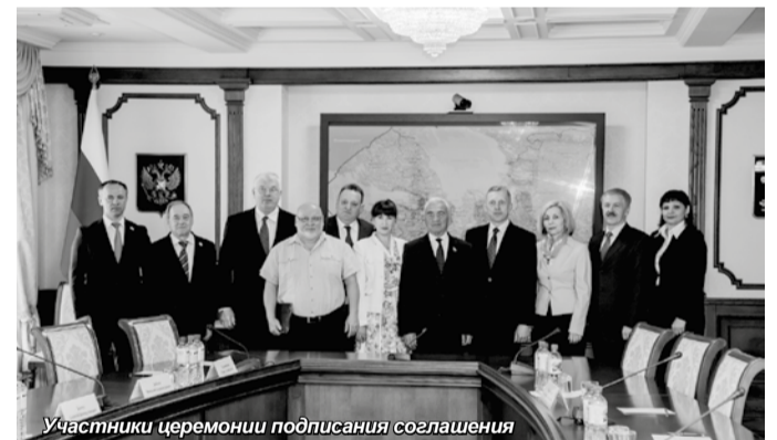
Участники церемонии подписания соглашения