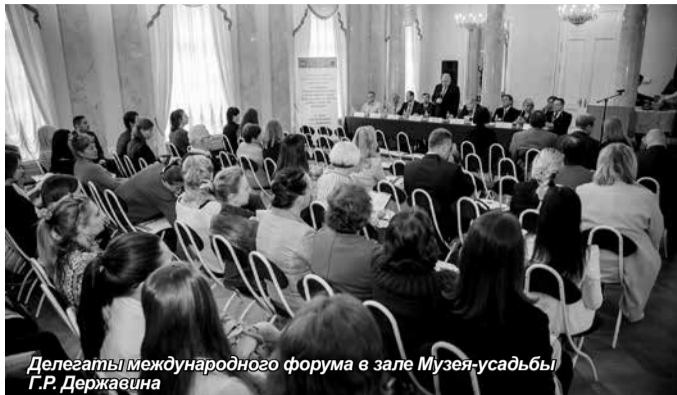
Делегаты международного форума в зале Музея-усадьбы Г.Р. Державина