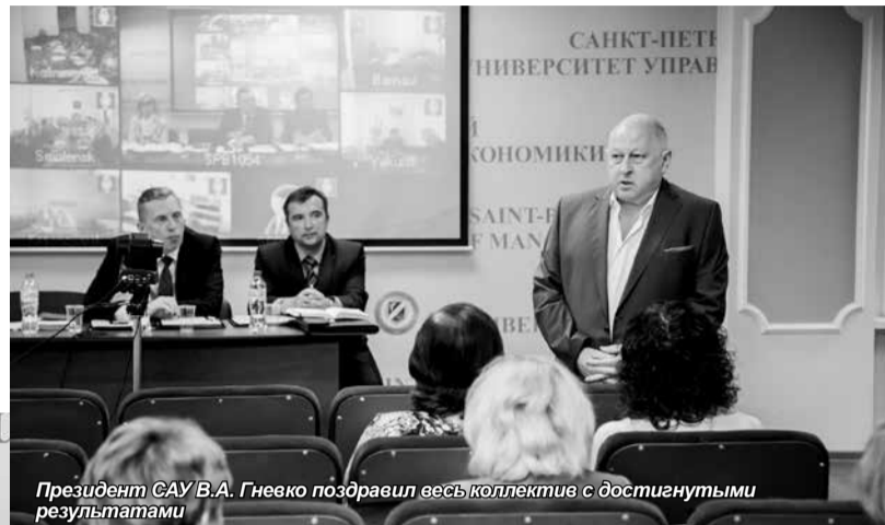
Президент САУ В.А. Гневко поздравил весь коллектив с достигнутыми результатами

Решением Ученого совета был утвержден План по устранению выявленных нарушений лицензионных требований,