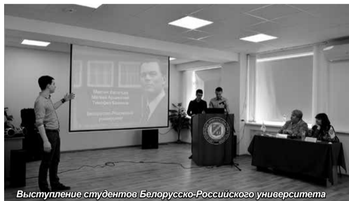
Выступление студентов Белорусско-Российского университета