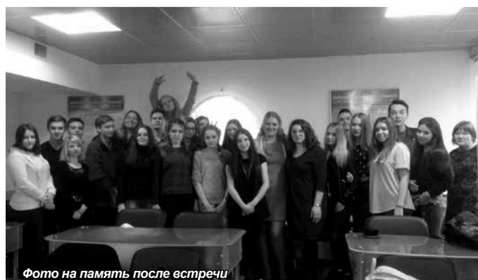
Фото на память после встречи