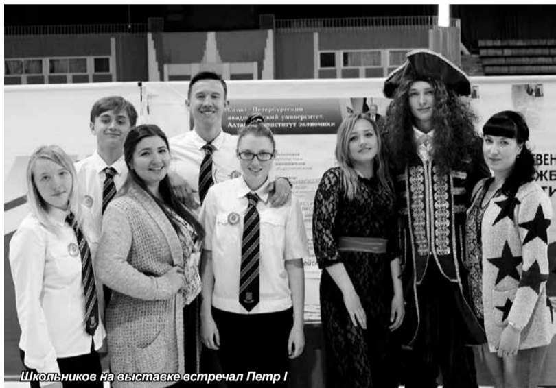
Школьников на выставке встречал Петр I

Алтайский институт экономики принял участие в профориентационной выставке образовательных услуг