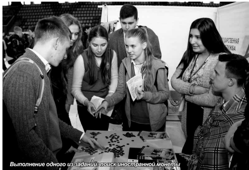
Выполнение одного из заданий: поиск иностранной монеты

Надеемся, что в новом учебном году наш вуз примет немало новых студентов.