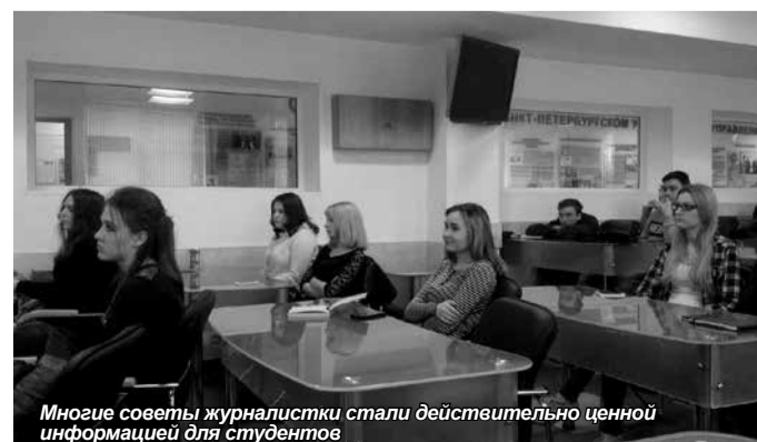
Многие советы журналистки стали действительно ценной информацией для студентов