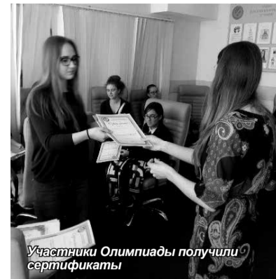
Участники Олимпиады получили сертификаты

Все участники Олимпиады получили сертификаты.