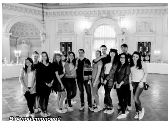
В белой столовой