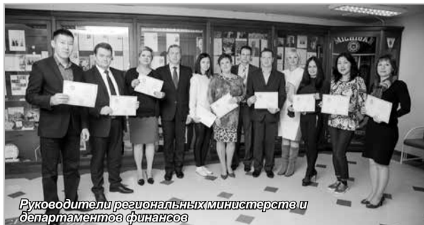
Руководители региональных министерств и департаментов финансов

Курс впервые был успешно реализован в декабре 2015 года, он уникален тем, что к его проведению привлекаются авторитетные эксперты в области градостроительства. Среди них специалисты из ОАО «Мосгипротранс», ООО «Институт