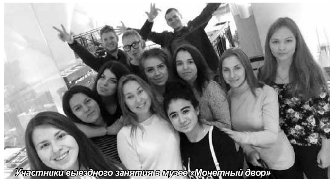
Участники выездного занятия в Музее «Монетный двор»