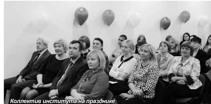
Коллектив института на празднике