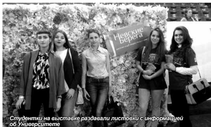
Студентки на выставке раздавали листовки с информацией об Университете