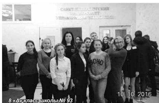
8 «А» класс школы № 93