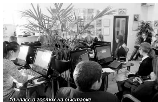
10 класс в гостях на выставке

Для посетивших выставку учеников школы были организованы экскурсии по учебно-гостиничному комплексу, в ходе которых школьников познакомили с направлениями довузовской и вузовской подготовки, реализуемых в Университете, с тем, как организованы учебный процесс, проживание и досуг студентов Университета.