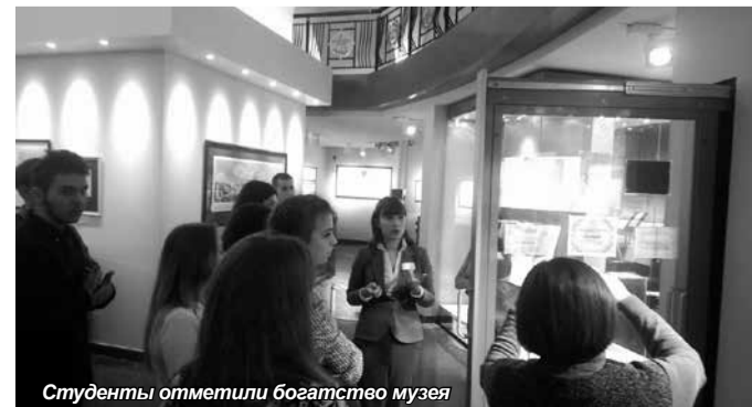
Студенты отметили богатство музея