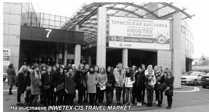
На выставке INWETEX-CIS TRAVEL MARKET

Отдельное спасибо нашему преподавателю А.Г. Гавриловой за организацию для нас на такого интересного, познавательного и интерактивного занятия.