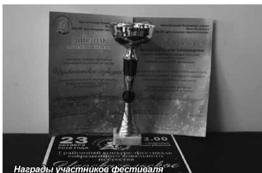
Награды участников фестиваля