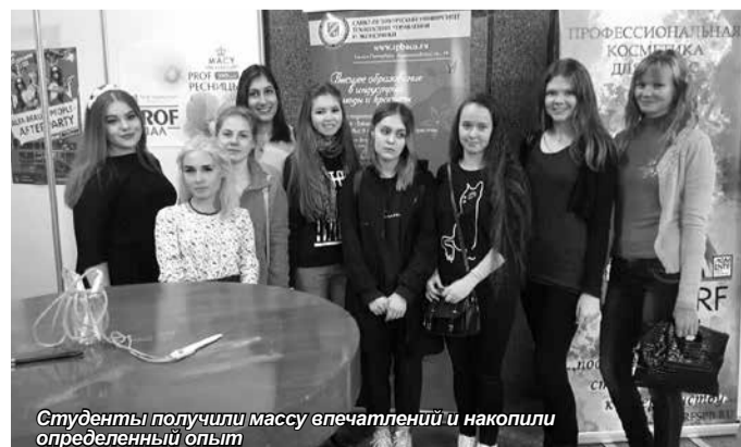
Студенты получили массу впечатлений и накопили определенный опыт