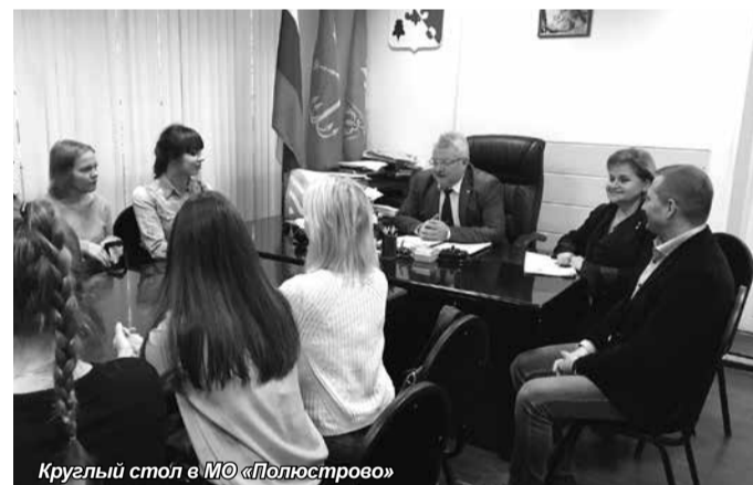
Круглый стол в МО «Полюстрово»