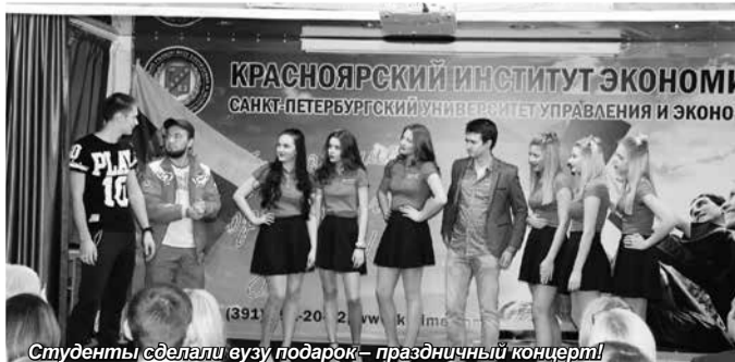
Студенты сделали вузу подарок – праздничный концерт!

информационных технологий на развитие экономики, местное самоуправление и гражданская самоорганизация, общество и социальная политика, роль туризма в социально-экономическом развитии, роль высшего профессионального образования в развитии экономики и управления – вот лишь некоторые из представленных тем. По материалам проведения конференции будет издан юбилейный выпуск сборника научных трудов.