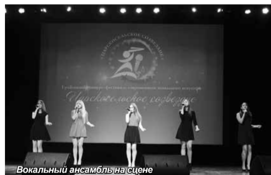
Вокальный ансамбль на сцене

Мы поздравляем всех участников и желаем им дальнейших творческих успехов и новых побед!