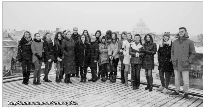
Студенты на новой площадке

дию, истории его создания. Петербург – первый в России город, который строился не стихийно, а по плану. С панорамной площадки как с высоты птичьего полета студенты смогут лично увидеть, как была реализована идея трёхлучевого развития Петербурга от Адмиралтейства, становившегося композиционным центром, где роль главной магистрали отводилась Невскому проспекту, «проложить» свои маршруты, основываясь на масштабном видении.