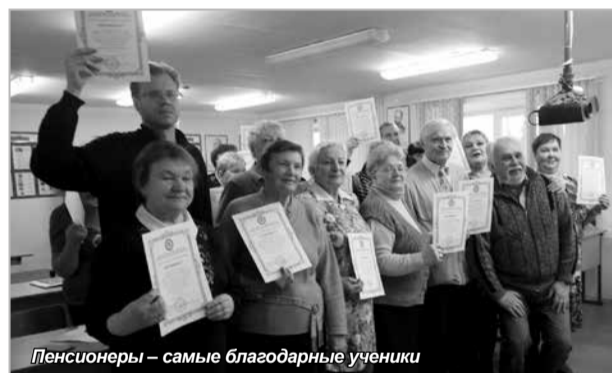
Пенсионеры – самые благодарные ученики

Подводя итоги проделанной работы, директор заказу Мурманского комплексного центра социального обслуживания