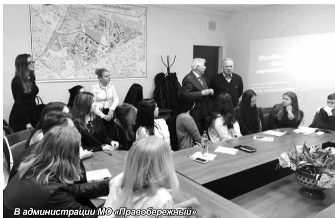
В администрации МО «Правобережный»