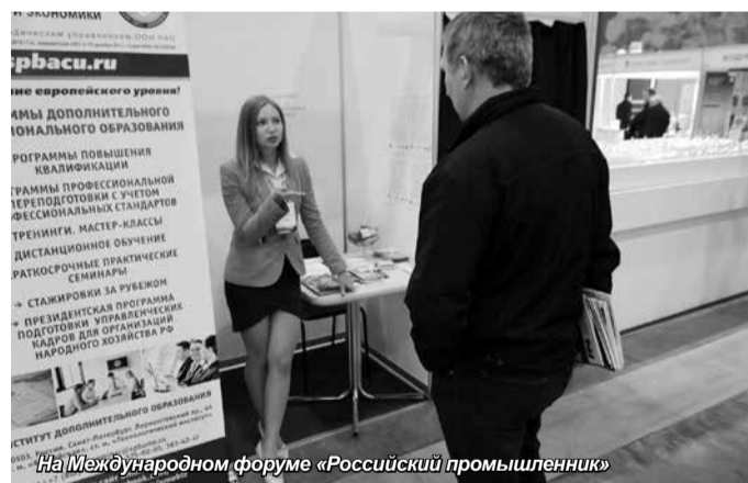
На Международном форуме «Российский промышленник»