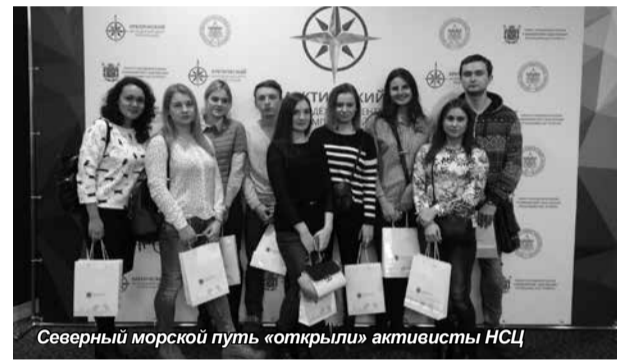
Северный морской путь «открыли» активисты НСЦ

транспортному и инфраструктурно-му развитию региона, рассказал о том, какие проекты уже завершены, и какие проблемы еще предстоит решить. Отличным дополнением доклада был интересный видеоролик о Ямало-Ненецком автономном округе.