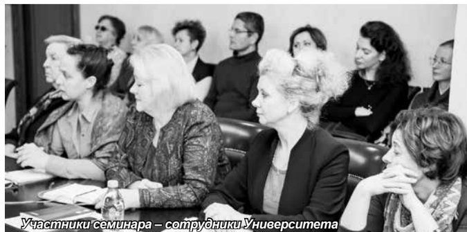
Участники семинара – сотрудники Университета

В итоге была сформирована рабочая группа, состоящая из представителей ИПРЭ РАН и СПбУТУиЭ, которая подготовит научный доклад для губернатора Санкт-Петербурга Г.С. Полтавченко и Комитета по науке и высшей школе, в котором будут сделаны предложения по актуализации приоритетов Стратегии социального и экономического развития Санкт-Петербурга до 2030 года.