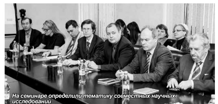
На семинаре определили тематику совместных научных исследований