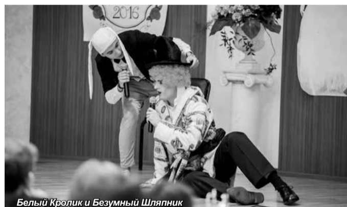
Белый Кролик и Безумный Шляпник