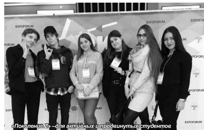
«Поколение Z» – для активных и продвинутых студентов