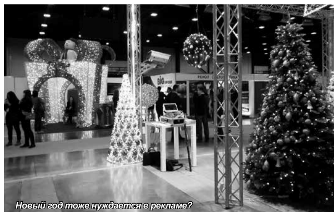
Новый год тоже нуждается в рекламе?

Отзыв будущих PR-специалистов даёт ясно понять, что конференция была проведена на высшем уровне. РИДО – это мощная информационная площадка, обязательная для посещения тем учащимся, кто хочет проявить себя уже на первых порах. Она будет крайне интересна и информативна как для первокурсников, так и для более опытных учащихся. Студенты могут задавать вопросы спикерам, рассуждать с ними о различных проблемах PR или же попросту слушать и узнавать о новых тенденциях – это именно те вещи, которые отложат свой отпечаток и, несомненно, помогут стать первоклассным мастером своего дела.