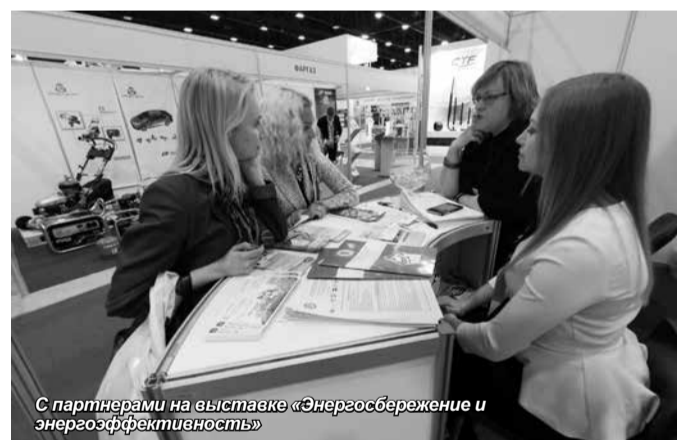
С партнерами на выставке «Энергосбережение и энергоэффективность»