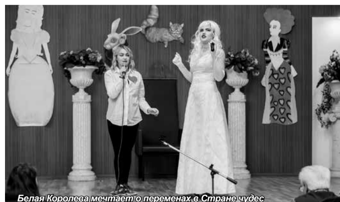
Белая Королева мечтает о переменах в Стране чудес