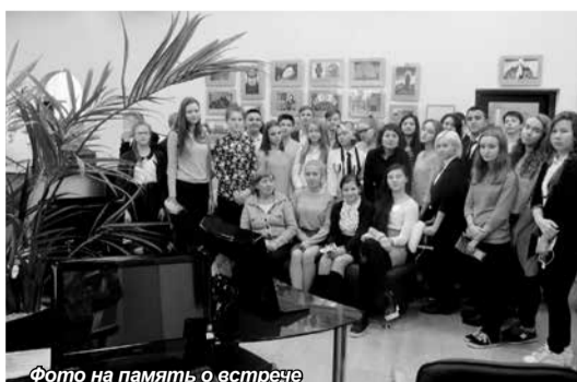
Фото на память о встрече