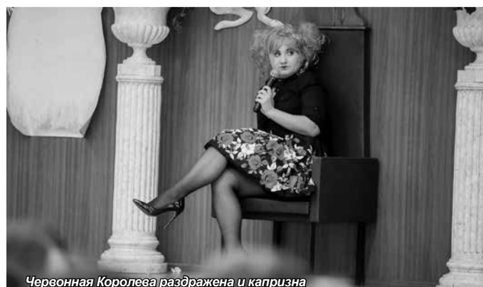
Червонная Королева раздражена и капризна