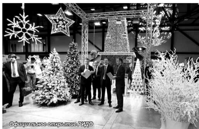
Официальное открытие РИДО

Наш сайт – http://umebiz.ru/ , мы в Фейсбуке – https://www.facebook.com/umebiz , мы в ВКонтакте – http://vk.com/umebiz .