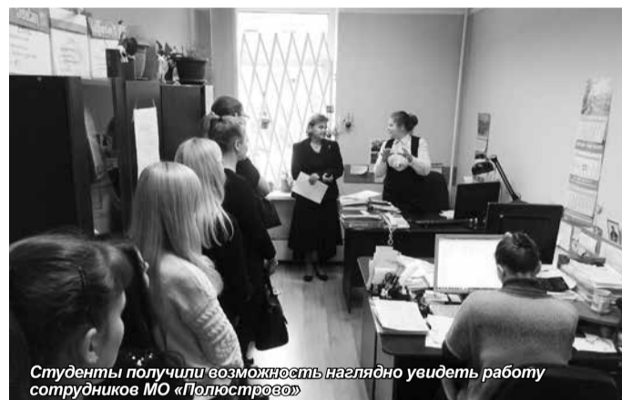
Студенты получили возможность наглядно увидеть работу сотрудников МО «Полюстрово»

Проведенные встречи вызвали у студентов живой отклик и желание продолжать практические выездные занятия в органах государственного и муниципального управления.