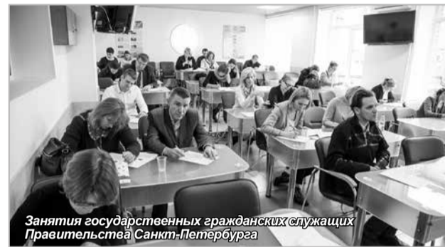
Занятия государственных гражданских служащих Правительства Санкт-Петербурга

Региональные специалисты по финансам отметили уникальность данной программы, разработанной в соответствии со спецификой работы регионов, а также пользу приобретенных знаний и навыков для своей дальнейшей работы.