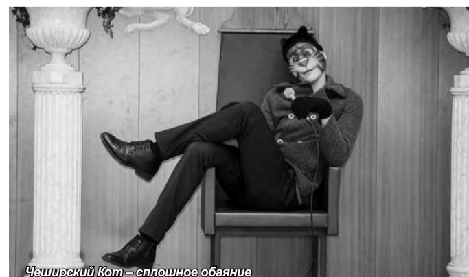
Чеширский Кот – сплошное обаяние