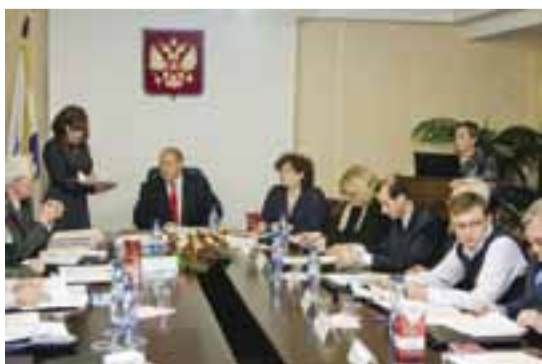
В Академии создан диссертационный совет.

За годы своей истории вуз прошел сложный, творческий путь от учебного центра «Профессионал» до Академии, которая сегодня является одним из крупнейших учебных заведений и широко известна в России и за рубежом. Все эти годы коллектив СПбАУЭ не только сохранял и передавал знания многим поколениям молодежи, но и выступал мощным генератором новых научных и образовательных идей. Благодаря работе высокопрофессиональных преподавателей, сотрудников, талантли-