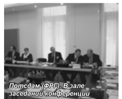
Потсдам (ФРГ). В зале заседаний конференции