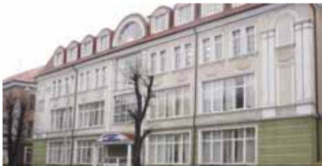
Начало создания филиалов в различных регионах России.