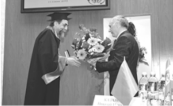
Газета «Менеджер» № 9, 16 июня