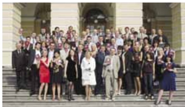
Академия вошла в шестерку вузов, отобранных Федеральной комиссией для реализации Президентской программы подготовки управленческих кадров для народного хозяйства РФ в регионе.