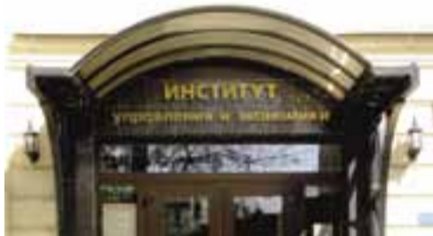
Государственный комитет РФ по высшему образованию выдал лицензию на право ведения образовательной деятельности в сфере профессионального образования. Курсы повышения квалификации обрели статус высшего учебного заведения с названием «Институт управления и экономики», или ИМЕ.