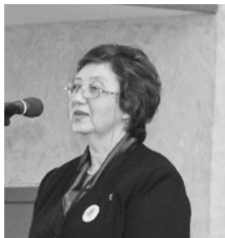
Газета «Менеджер» № 15, 16 сентября