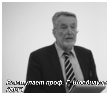
Выступает проф. Г. Шведиауэр (ФРГ)