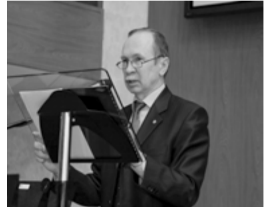
Газета «Менеджер» № 5, 19 апреля

С докладом о правовом регулировании создания малых инновационных предприятий научными и образовательными учреждениями в СПбАУЭ выступил директор Департамента государственной научно-технической и инновационной политики Министерства образования и науки РФ А.В. Наумов. Он подчеркнул, что интеграция науки, образования и реального производства позволит повысить качество подготовки специалистов, исходя из реальных потребностей инновационного развития экономики России.