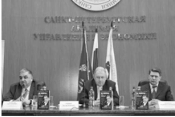
Газета «Менеджер» № 5, 19 апреля

Санкт-Петербургская академия управления и экономики регулярно организует встречи представителей деловых и научных кругов для обсуждения актуальных проблем экономического развития страны. 29 марта предметом обсуждения стали условия, которые необходимы для технологического, экономического и социального рывка в развитии России. Академик РАН, почетный профессор СПбАУЭ А.Г. Аганбегян специально приехал в Академию по приглашению ректора, проф. В.А. Гневко для презентации своей новой книги «Экономика России на распутье. Выбор посткризисного пространства».