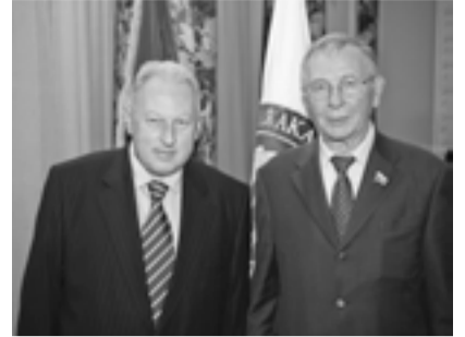
Газета «Менеджер» № 16, 1 сентября