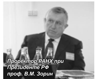
Проректор РАНХ при Президенте РФ проф. В.М. Зорин