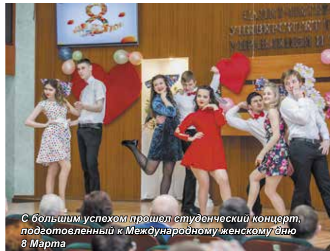
С большим успехом прошел студенческий концерт, подготовленный к Международному женскому дню 8 Марта