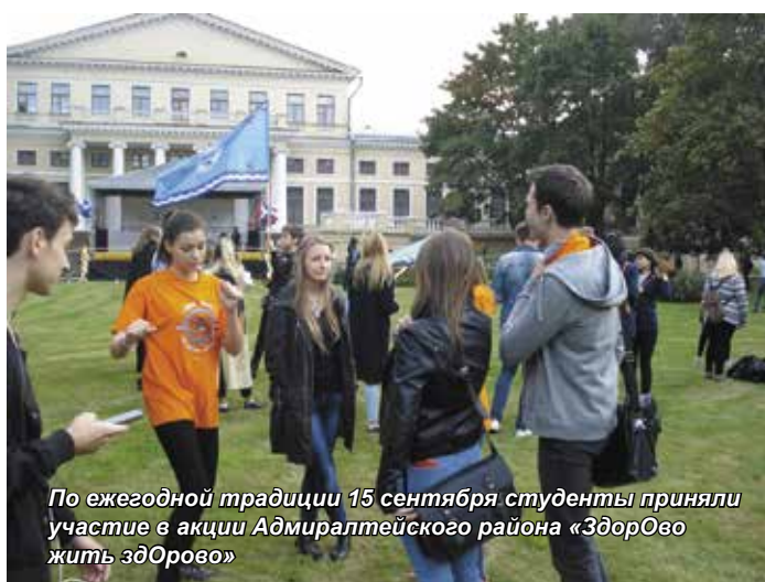
По ежегодной традиции 15 сентября студенты приняли участие в акции Адмиралтейского района «Здоровое жить здорово»