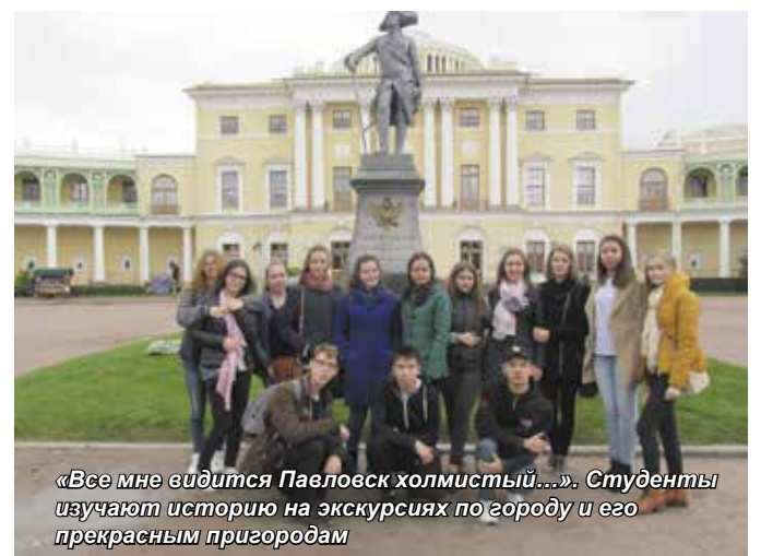
«Все мне видится Павловск холмистый...». Студенты изучают историю на экскурсиях по городу и его прекрасным пригородам