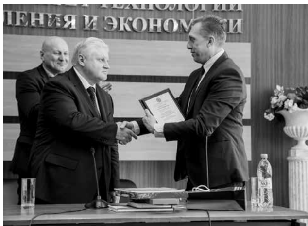
Газета «Менеджер» № 6, 17 апреля