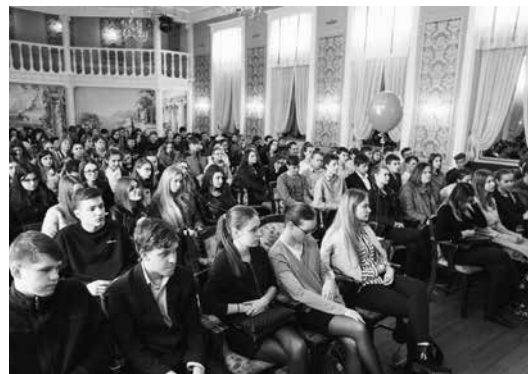
Газета «Менеджер» № 8, 31 мая

Управление по набору СПбУТиЭ и Институт электронного обучения совместно с Калининградским институтом экономики реализовали серию оригинальных мероприятий по работе с учениками и учителями школ г. Калининграда и Калининградской области. В рамках программы «Электронное обучение и инновационное профориентирование» 24 и 25 апреля для учащихся были проведены семинары по деловой презентационной графике, тестирование, а также деловая игра «Инновационные технологии в экономическом проектировании», параллельно с представителями администрации и учителями школ был организован интерактивный мастер-класс «Мобильные технологии при взаимодействии с живой аудиторией».