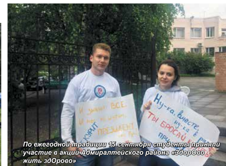
По ежегодной традиции 15 сентября студенты приняли участие в акции Адмиралтейского района «Здоровое жить здорово»