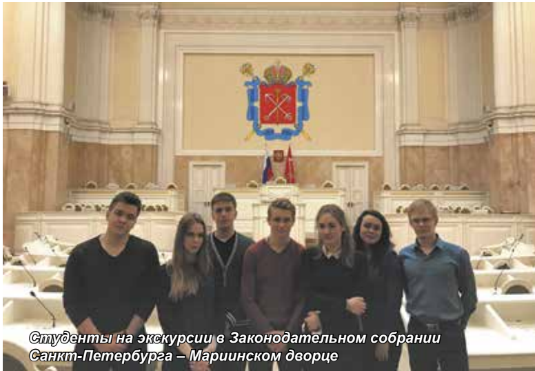
Студенты на экскурсии в Законодательном собрании Санкт-Петербурга – Мариинском дворце