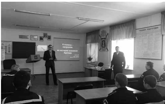
Информация Мурманского института экономики

Во второй части встречи военнослужащим были презентованы программы высшего образования, реализуемые Санкт-Петербургским университетом технологий управления и экономики.