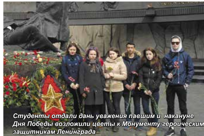
Студенты отдали дань уважения павшим и накануне Дня Победы возложили цветы к Монументу героическим защитникам Ленинграда