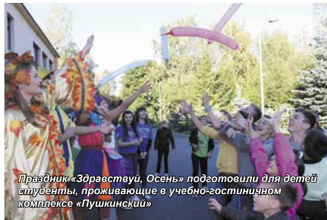
Праздник «Здравствуй, Осень» подготовили для детей студенты, проживающие в учебно-гостиничном комплексе «Пушкинский»