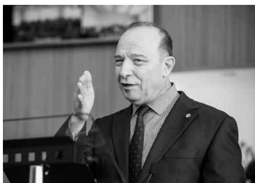
Газета «Менеджер» № 5, 31 марта