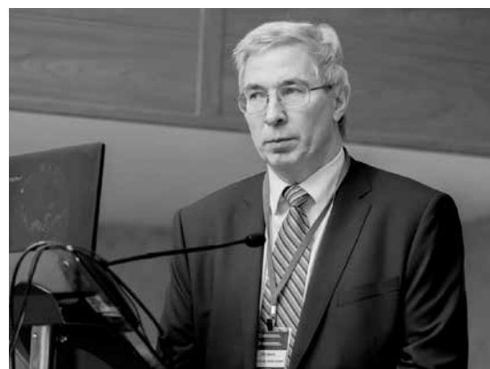
Газета «Менеджер» № 19, 30 ноября