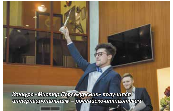
Конкурс «Мистер Первокурсник» получился интернациональным – российско-итальянским