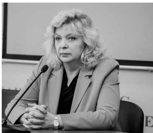
Газета «Менеджер» № 8, 31 мая

На прощание гостю в благодарность за выступление и с искренней признательностью за ее деятельность подарили букет, а также вручили сувенирную и рекламную продукцию Университета.