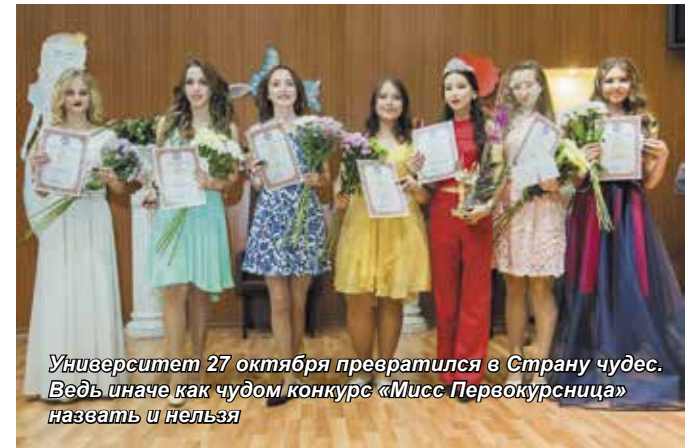
Университет 27 октября превратился в Страну чудес. Ведь иначе как чудом конкурс «Мисс Первокурсница» назвать и нельзя