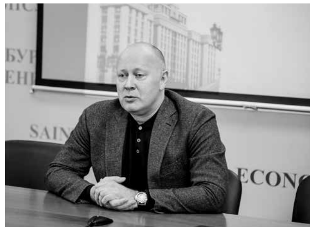
Газета «Менеджер» № 6, 17 апреля