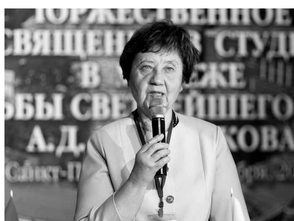
Газета «Менеджер» № 15, 28 сентября