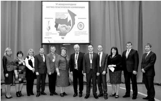
Газета «Менеджер» № 7, 28 апреля

Ежегодно конференция объединяет представителей исполнительной власти области, предпринимателей, профессорско-преподавательский состав и студентов вузов города. Программными темами этого года стали направления поддержки малого и среднего бизнеса в регионе, изменения в налоговом законодательстве в сфере предпринимательства, государственно-частное партнерство, проблемы и перспективы приграничного сотрудничества Смоленской области с Республикой Беларусь.