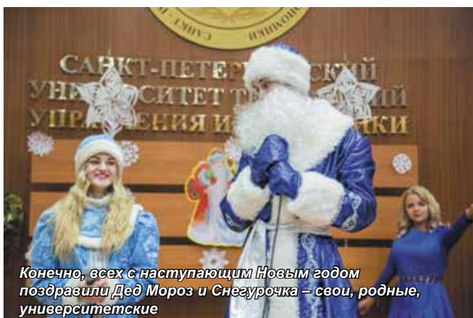
Конечно, всех с наступающим Новым годом поздравили Дед Мороз и Снегурочка – свои, родные, университетские