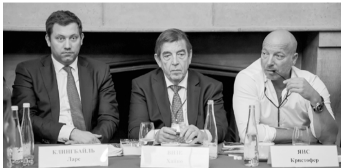
Газета «Менеджер» № 17, 31 октября