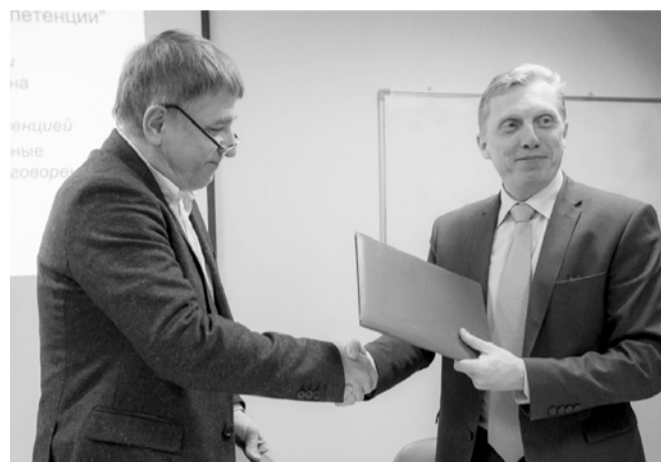
Газета «Менеджер» № 19, 30 ноября

В рамках своего визита в Санкт-Петербургский университет технологий управления и экономики Е.В. Головки прочитал для студентов первого курса, обучающихся по направлению «Лингвистика», открытую лекцию о межкультурных коммуникациях.