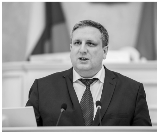
Газета «Менеджер» № 2, 15 февраля