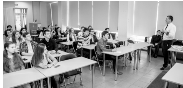
Газета «Менеджер» № 15, 29 сентября

Профессор из немецкого вуза-партнера прочитал студентам СПбУТУиЭ лекцию на английском «Управление качеством в фазе утилизации и послепродажного обслуживания». Коллеги из Германии также встретились с сотрудниками международного отдела СПбУТУиЭ, договорились о совместных мероприятиях, участии в международных неделях.