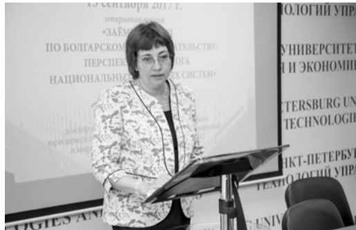
Газета «Менеджер» № 14, 15 сентября