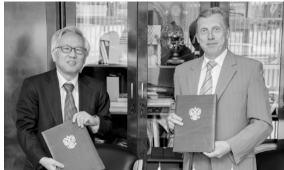
а также внедрении новых технологий, научных разработок и проектов в области управления и экономики.