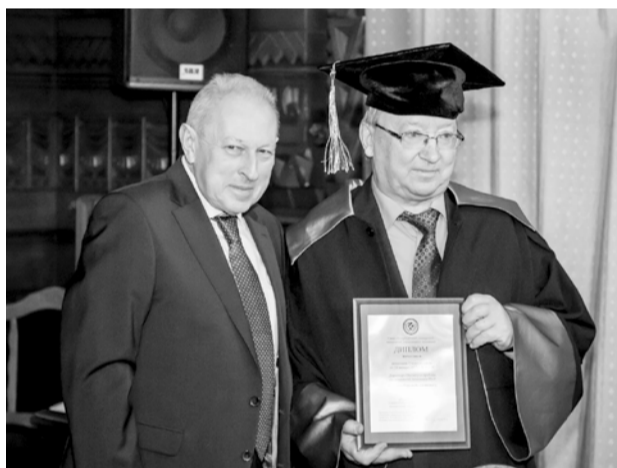
Газета «Менеджер» № 12-13, 1 сентября