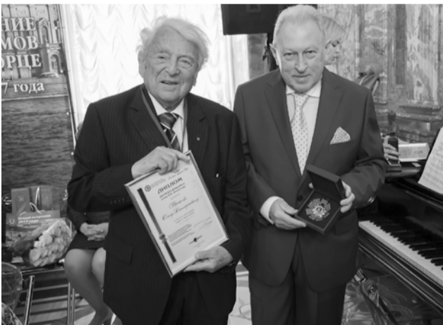
Газета «Менеджер» № 12-13, 1 сентября