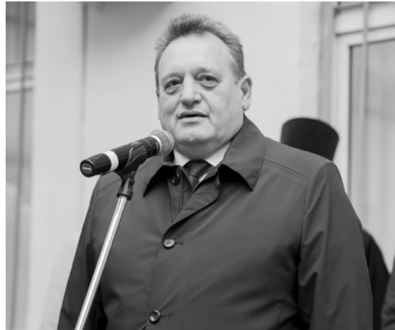
Газета «Менеджер» № 16, 17 октября