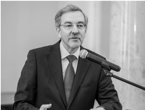
Газета «Менеджер» № 18, 17 ноября