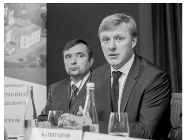
Газета «Менеджер» № 17, 31 октября