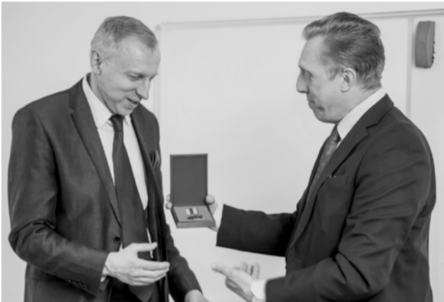
Газета «Менеджер» № 7, 28 апреля

В рамках проходящей в Санкт-Петербургском университете технологий управления и экономики Недели науки 22 ноября был подписан новый расширенный договор о сотрудничестве с Институтом лингвистических исследований РАН.