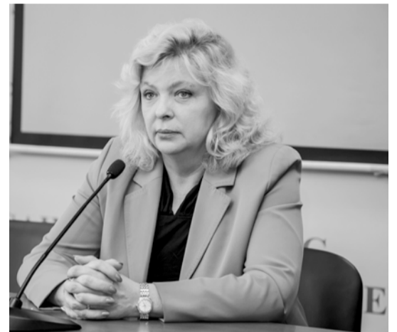
Газета «Менеджер» № 8, 31 мая

На прощание гостю в благодарность за выступление и с искренней признательностью за ее деятельность подарили букет, а также вручили сувенирную и рекламную продукцию Университета.