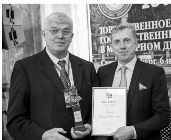
Газета «Менеджер» № 14, 15 сентября

Председатель Постоянной комиссии по законодательству, регламенту, депутатской этике Законодательного собрания Ленинградской области В.А. Густов на торжественной церемонии в Мраморном дворце отметил, что область как никогда динамично развивается, и молодых специалистов, окончивших Санкт-Петербургский университет технологий управления и экономики, там всегда ждут.