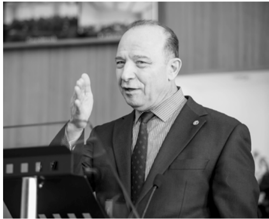
Газета «Менеджер» № 2, 15 февраля