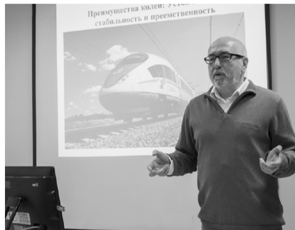
Газета «Менеджер» № 19, 30 ноября