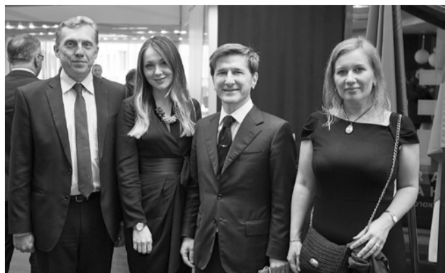
ную продукцию вуза и именное приглашение на день выпускника.

В Генеральном консульстве Италии в Санкт-Петербурге 5 июня прошел прием по случаю Дня провозглашения Итальянской Республики.