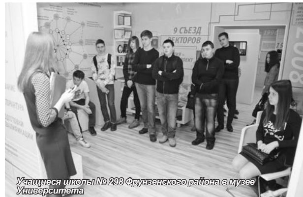
Учащиеся школы № 298 Фрунзенского района в музее Университета

На лекции студенты подробно изучили все аспекты, связанные с анализом инвестиционных проектов, а также затронули основные элементы анализа инвести-