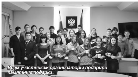
Всем участникам организаторы подарили памятные подарки

Затем сотрудниками Транспортной полиции была проведена викторина для наших студентов. Игра была очень интересной, веселой, связанной со знаниями о правах человека. В конце викторины всем участникам организаторы подарили памятные подарки.