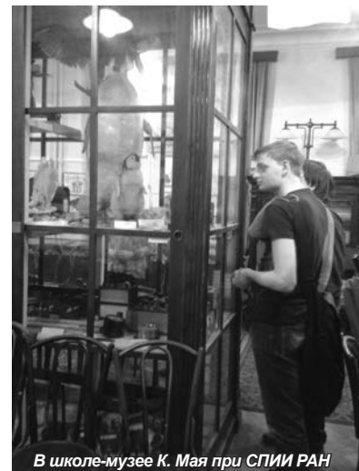
В школе-музее К. Мая при СПИИ РАН