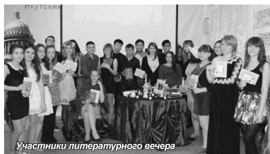
Участники литературного вечера

После того, как все выступили, жюри подвело итоги, и всем участникам были подарены красивые сертификаты и книги. Между прочим, очень интересные. Кому-то достались «Анна Каренина», собрание стихотворений известных и малоизвестных авторов. Все были очень довольны и рады, всем понравился литературный вечер. И