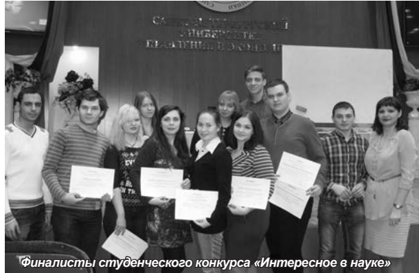
Финалисты студенческого конкурса «Интересное в науке»

онных проектов, такие как роль инвестиций в увеличении рыночной стоимости предприятия; формирование денежных поступлений (денежные потоки – Cash flow); экономический срок жизни инвестиций; что такое ликвидационная стоимость активов.